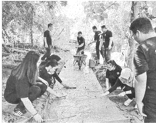
KEMAHIRAN: Kerja-kerja menyimen laluan.