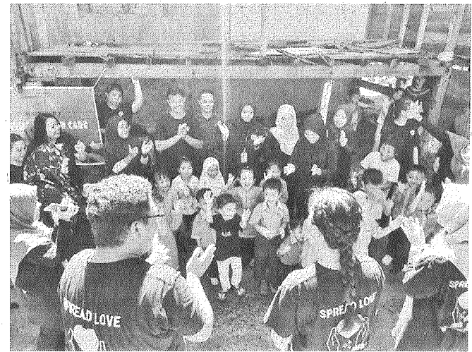
RIANG RIA: Aktiviti bersama pelajar Tabika.

petang beberapa kerja turut dijalankan seperti melukis mural, mengutip sampah dan menyediakan jalan (laluan