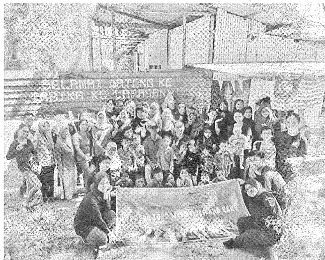
KENANGAN: Acara bergambar beramai-ramai.

dah bersama pelajar Tabika yang dikendalikan beberapa pelajar UMS.