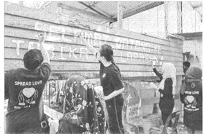
KECERIAAN: Aktiviti mengecat ruang dalam dan luar Tabika.