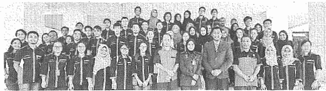
RAKAM KENANGAN: Pegawai bomba merakamkan kenangan bersama peserta program.