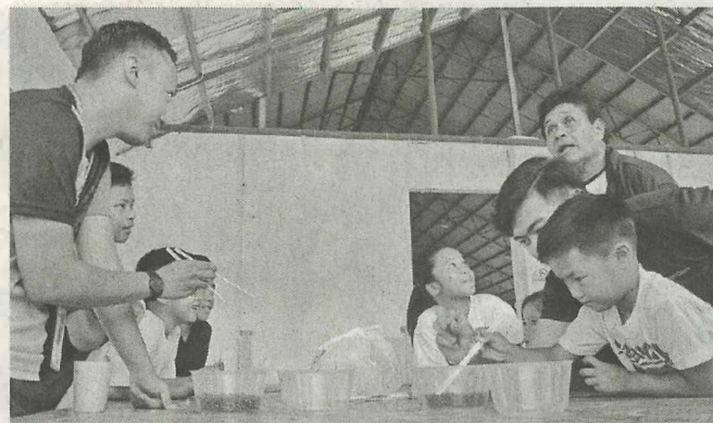
SUKANEKA: Salah satu aktiviti sukaneka bersama dengan keluarga angkat.