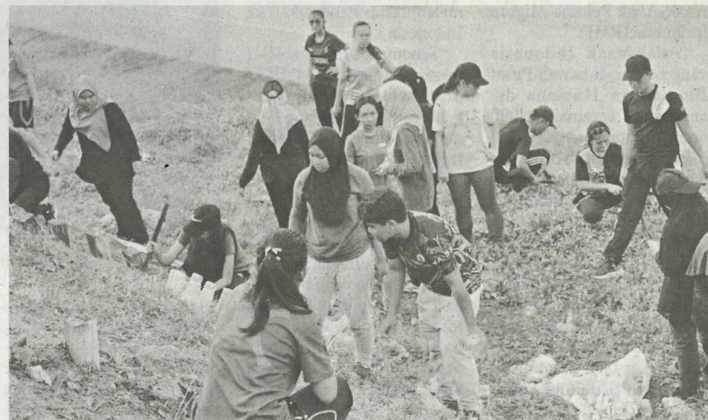
KERJASAMA: Aktiviti gotong-royong membersihkan dan mencantikkan semula tugu Kg Salarom Taka.