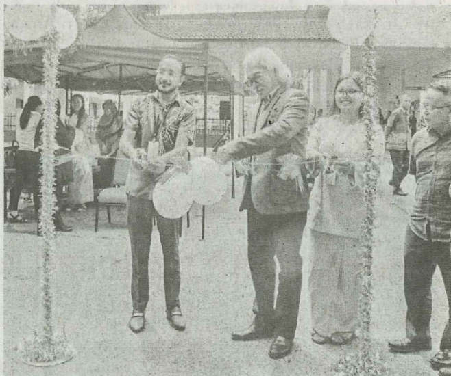
GUNTINGREBEN: Sesi menggunting reben menandakan perasmian Program Bazaria FPP 4.0.