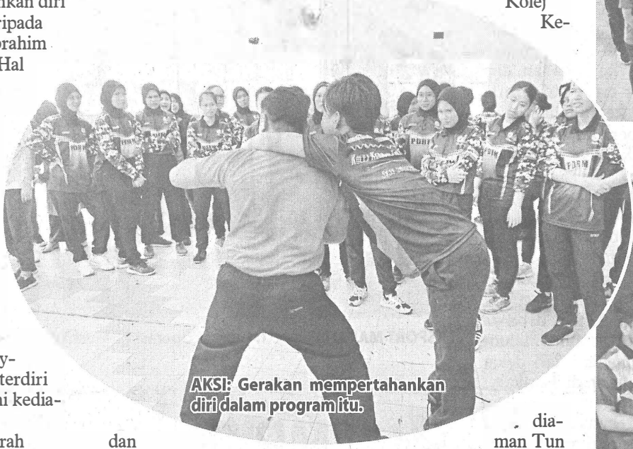
AKSI: Gerakan mempertahankan diri dalam program itu.

Semasa majlis penutupan program Women's Self Defense, turut hadir Timbalan Pengetua Kolej Ke-