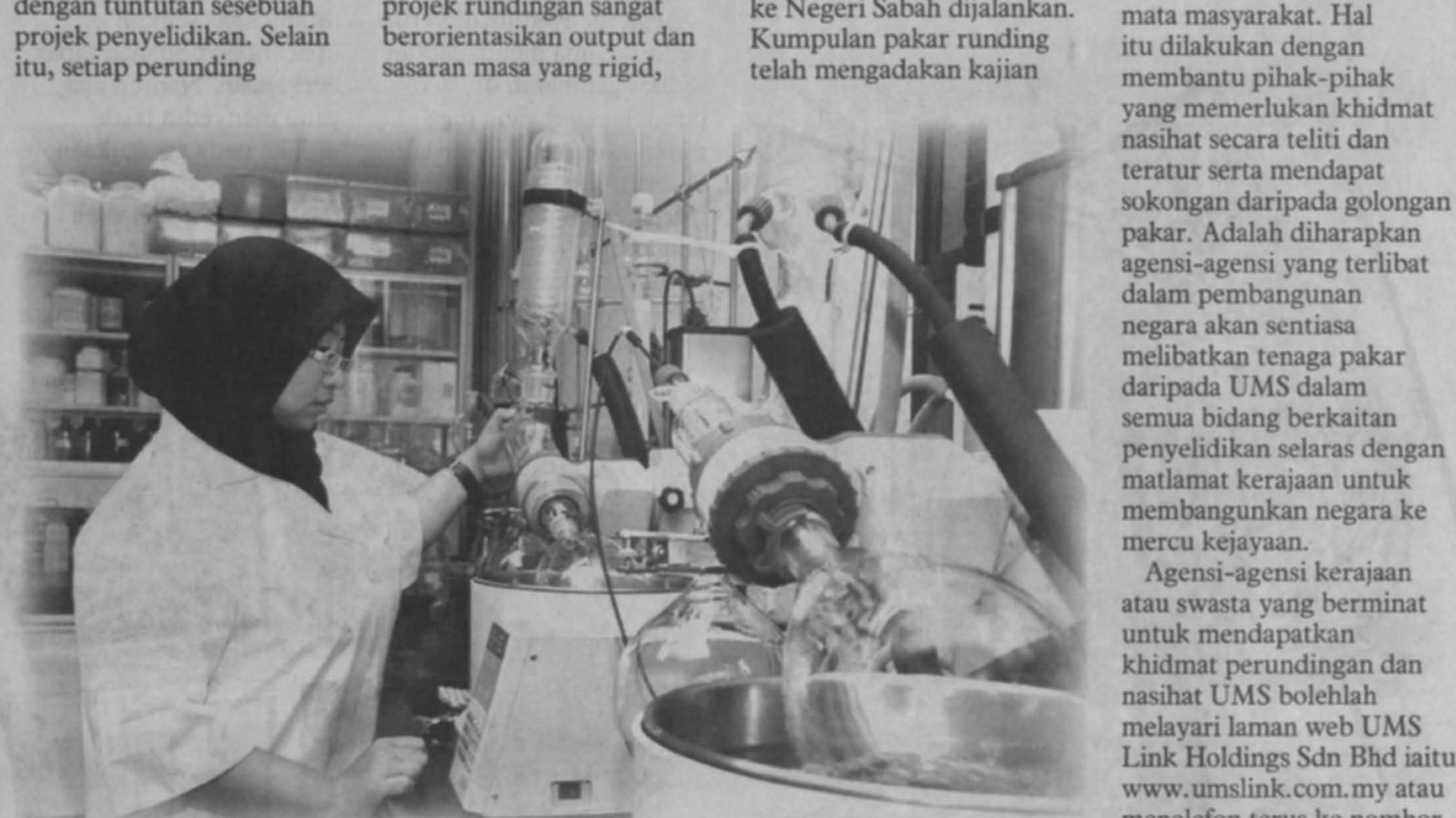
Khidmat bagi bagi peningkatan pengurusan sumber manusia.