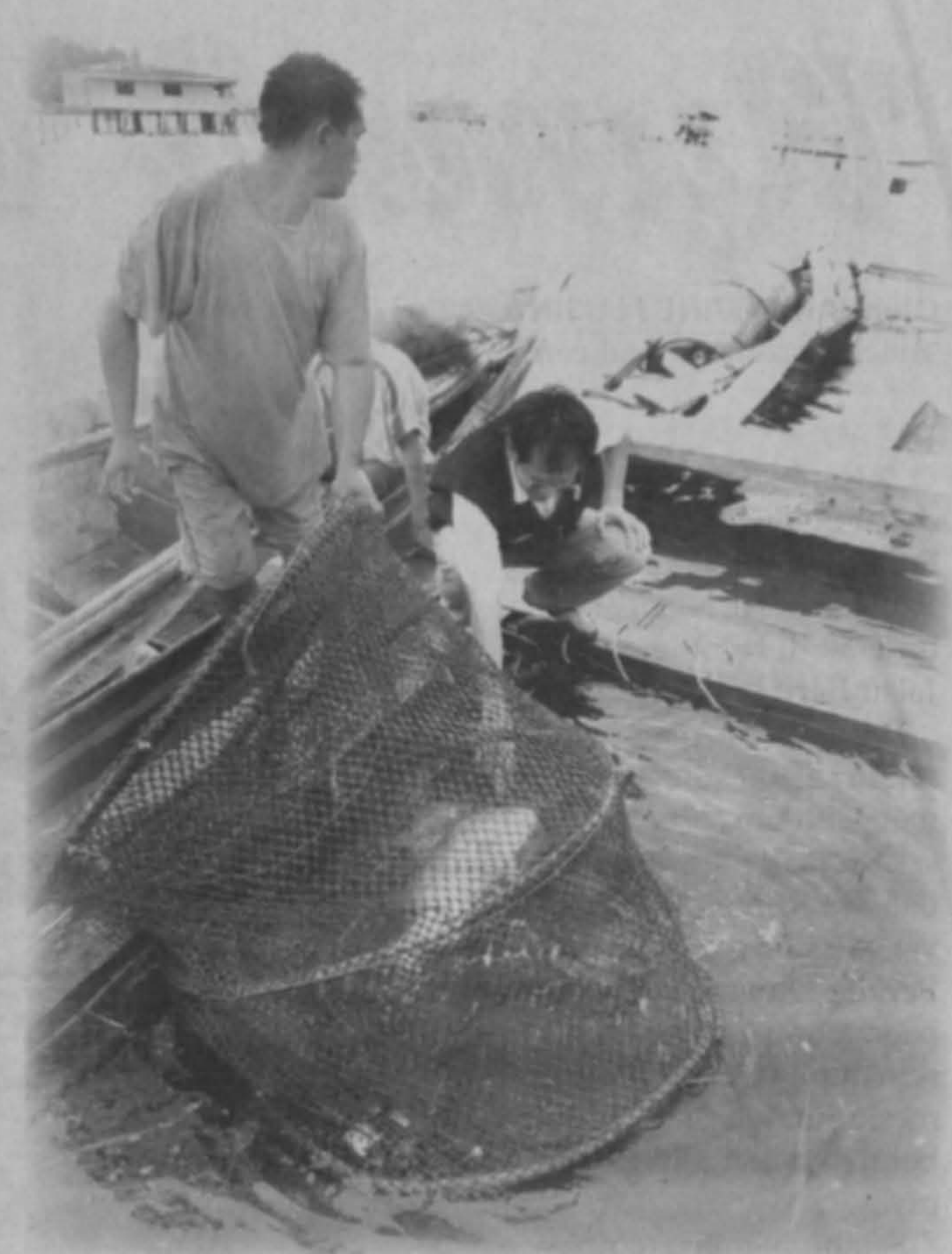
Khidmat rundingan dan khidmat nasihat akuakultur dan marin.