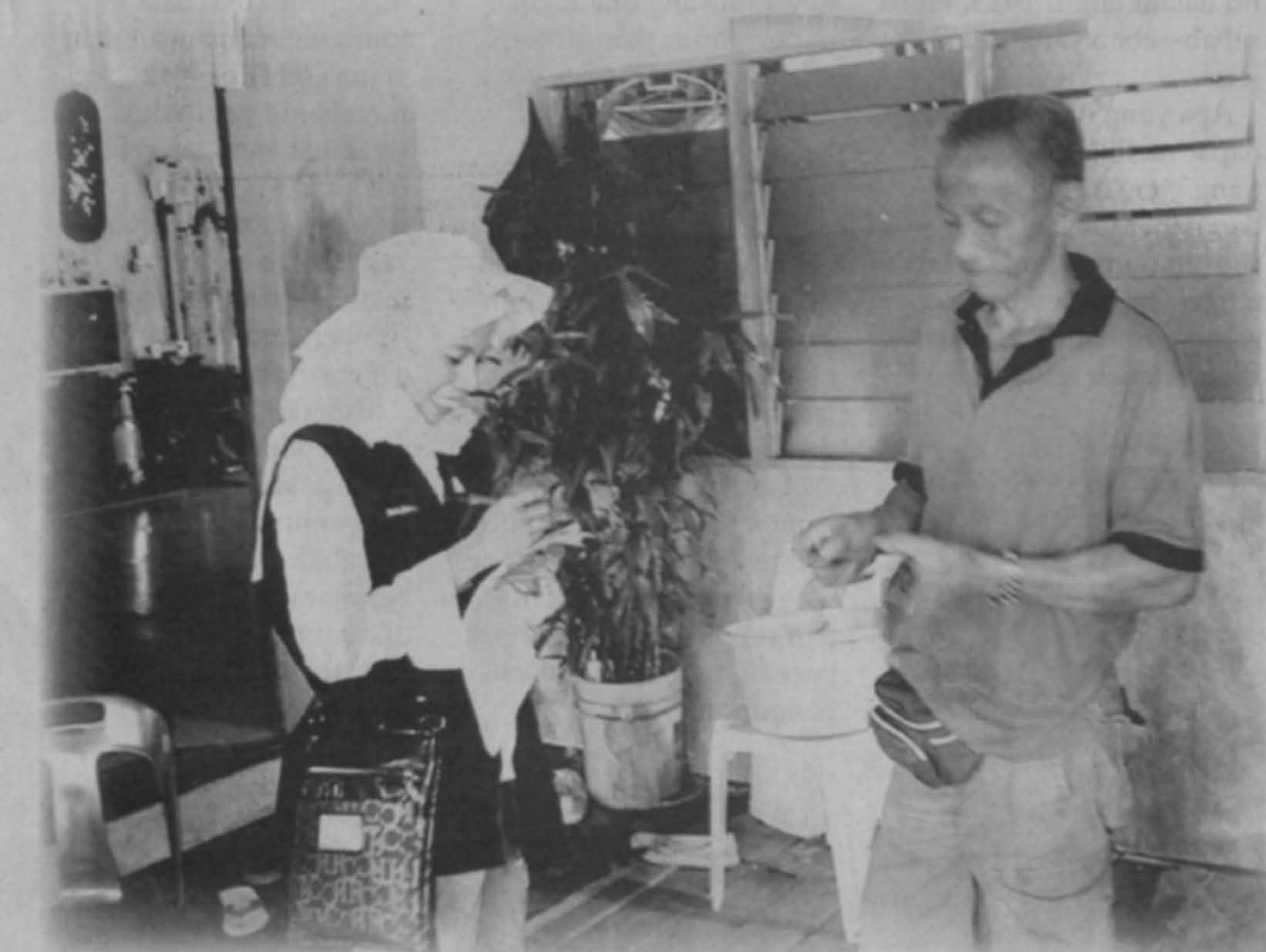
Sosio-ekonomi menjadi sebahagian bidang perundingan UMS.

Agensi-agensi kerajaan atau swasta yang berminat untuk mendapatkan khidmat perundingan dan nasihat UMS bolehlah melayari laman web UMS Link Holdings Sdn Bhd iaitu www.umslink.com.my atau menelefon terus ke nombor 088-485 575 (bahagian pemasaran).