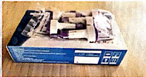
KAJIAN: Kit ujian COVID-19 yang akan dikaji UMS.