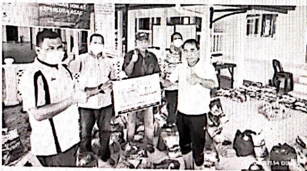
SUMBANGAN: Penyampaian sumbangan Food Bank.