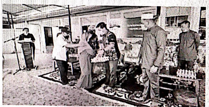
RINGKANKAN BEBAN: Penyampaian sumbangan kepada OKU.