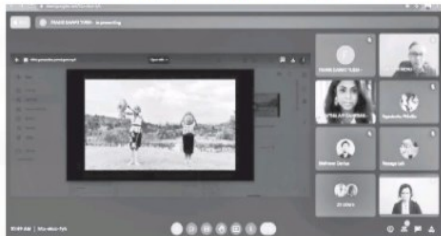
BENKEL: Segmen kesenian Lundayeh antara perkongsian yang disediakan penganjur.

Bengkel berunsur pemindahan ilmu berdasarkan upaya menanam kesedaran tentang tradisi Lundayeh itu dijalankan melalui sokongan dari pihak pentadbiran PPIB, UMS dengan kerjasama penuh penduduk dari dua kampung berkenaan.