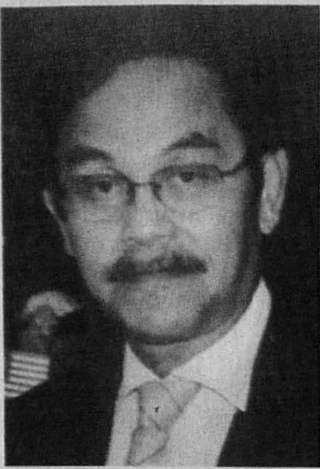
CATATAN KANVAS KOYAK