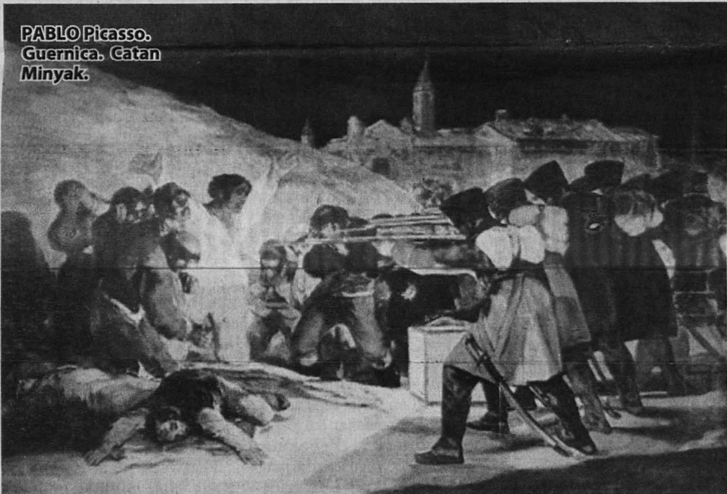
PABLO Picasso. Guernica. Catan Minyak.

***PENULIS merupakan Pensyarah Seni Visual, Fakulti Kemanusiaan, Seni dan Warisan di Universiti Malaysia Sabah (UMS).***