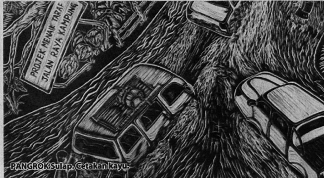
PANGROK Sulap. Cetakan kayu.

Maka di sini kita melihat bagaimana peranan seni lukis terutama sekali seni grafik berperanan mempengaruhi atau membentuk pemikiran khalayak, sepertimana