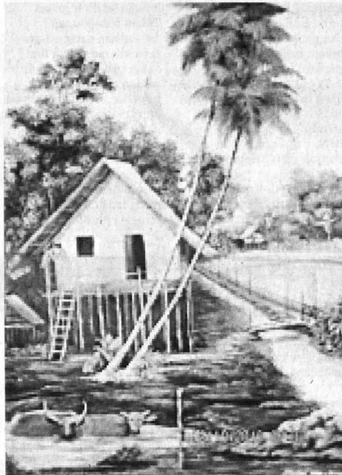
KAMPUNG Ku. Catan Minyak.

Sebagai seorang pelukis didikan sendiri, Maduni bebas dan tidak terpengaruh dengan aliran tertentu dalam pendekatan beliau menghasilkan karya. Sejak mula lagi jika dilihat karya beliau pada tahun 2010 seperti kebiasaan pelukis muda ini minat