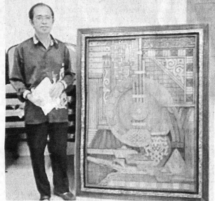
MADUNI dan karya arca timbul.

Di samping itu beliau juga sangat berminat kepada lukisan alam benda dan alam semula jadi, oleh sebab itu banyak karya beliau yang dihasilkan berdasarkan kepada tajuk seperti Sirih Pinang, Rimba Kinabalu dan di Tepi