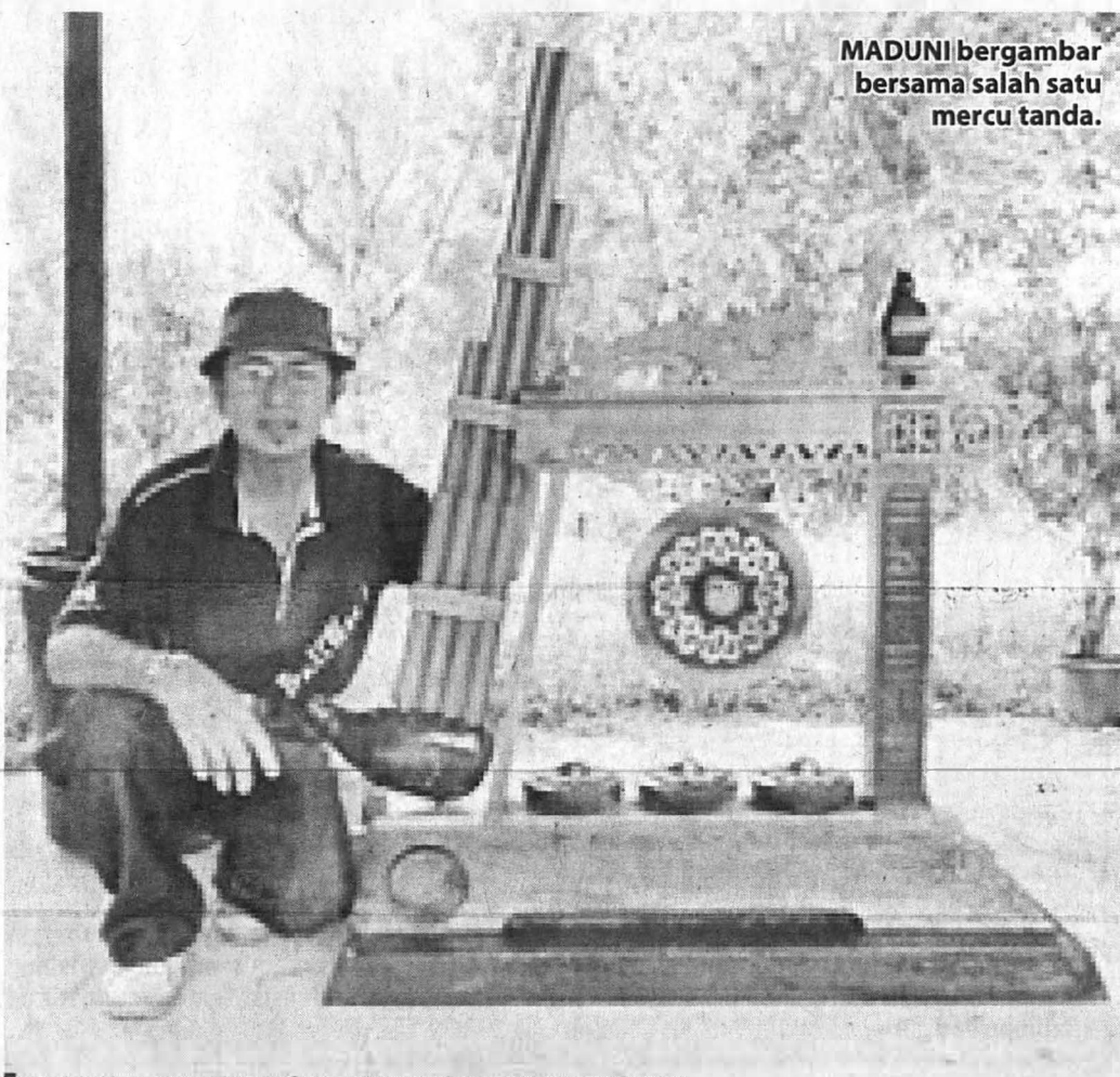
MADUNI bergambar bersama salah satu mercu tanda.

***PENULIS merupakan Pensyarah Seni Visual, Fakulti Kemanusiaan, Seni dan Warisan di Universiti Malaysia Sabah (UMS).***