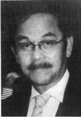
CATATAN KANVAS KOYAK