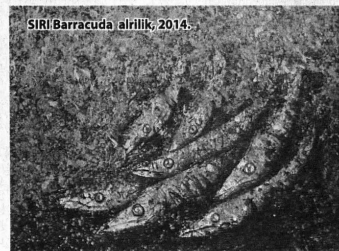
SIRI Barracuda alirilik, 2014.

akibat alam yang tercemar dan tidak dipedulikan. Karya dalam siri ini sangat mantap kerana kepakaran pelukis menggambarkan beberapa hidupan hutan tropika di Borneo sebagai jantung utama dunia.