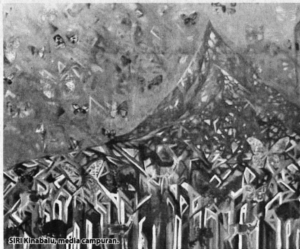
SIRI Kinabalu, media campuran.

Alam serta pemandangan kehidupan nelayan di pesisir Laut China Selatan yang terbentang di kampung beliau telah menanamkan pengalaman