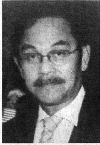
CATATAN KANVAS KOYAK