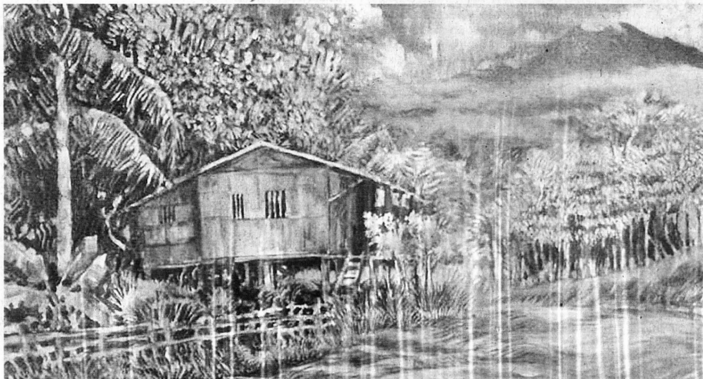
KAKI Gunung Kinabalu. Media campuran. 2017.

***PENULIS merupakan Pensyarah Seni Visual, Fakulti Kemanusiaan, Seni dan Warisan di Universiti Malaysia Sabah (UMS).***