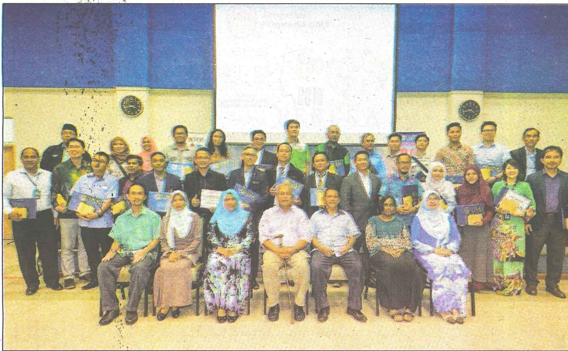
PEMENANG... Para pemenang anugerah merakamkan gambar kenangan.