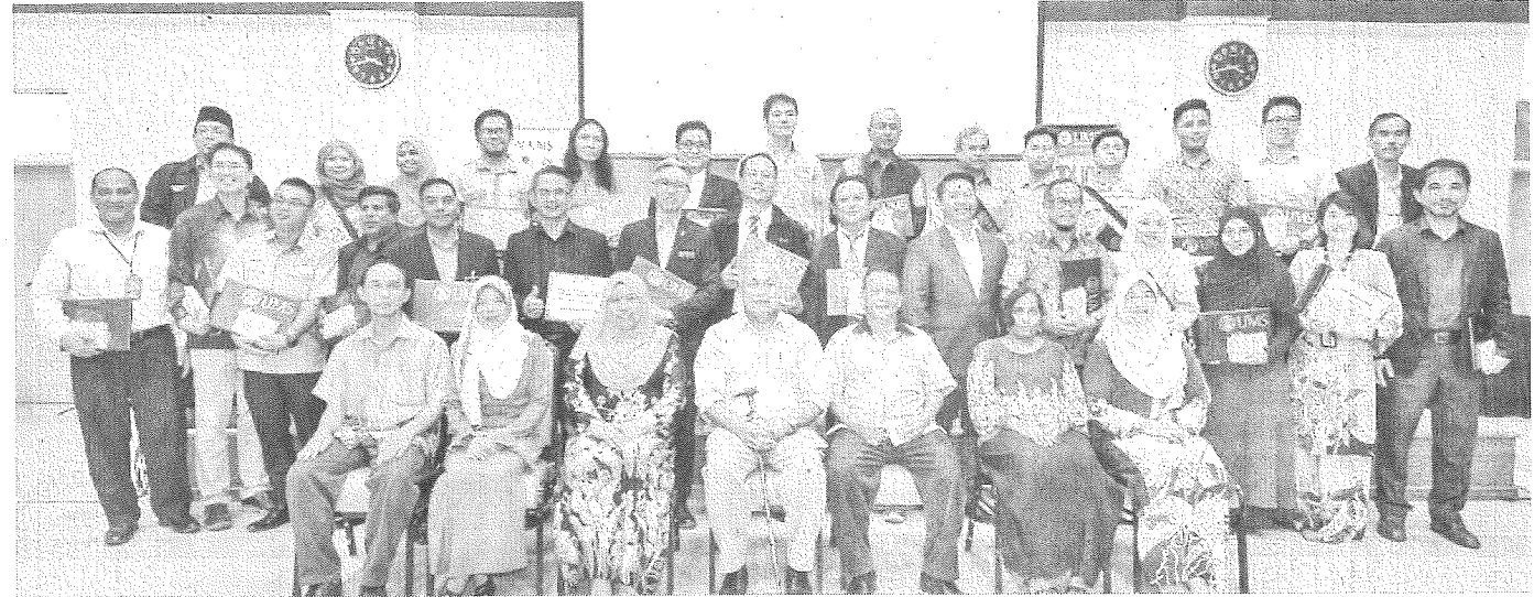
PARA pemenang anugerah merakamkan gambar kenangan.