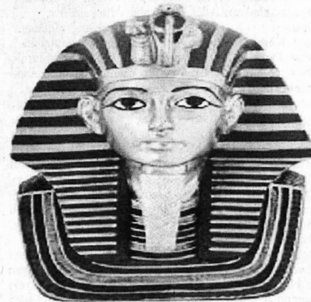
TOPENG Potret Maharaja Tutankhamen.