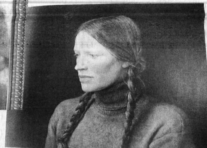
HELGA oleh Andrew Wyeth. Media tempa telur.

P OTRET adalah salah satu genre seni lukis yang susah untuk diberi definisi kerana boleh dikatakan semua orang sangat memahami dan mengenali seni potret sedikit sebanyak dalam hidup mereka.