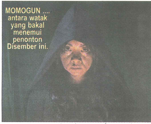
MOMOGUN .... antara watak yang bakal menemui penonton Disember ini.

Sinopsis filem ini mengisahkan tentang dua sahabat baik bernama Idu dan Igama yang tinggal di sebuah perkampungan di Sabah. Mereka berdua sangat dikenali