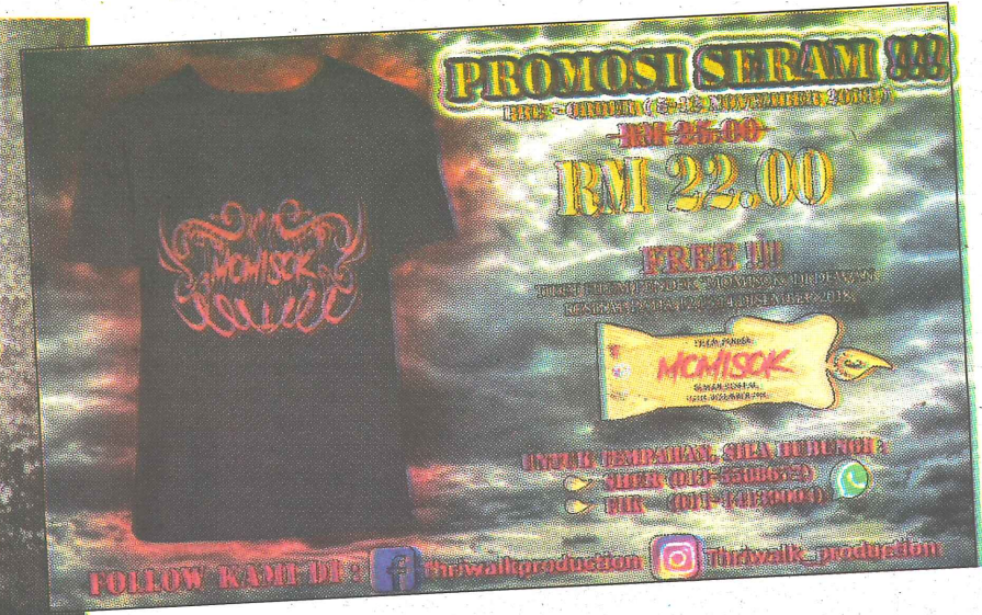
POSTER PRODUKSI ... baju T-Shirt yang dijual bersama satu tiket penayangan.