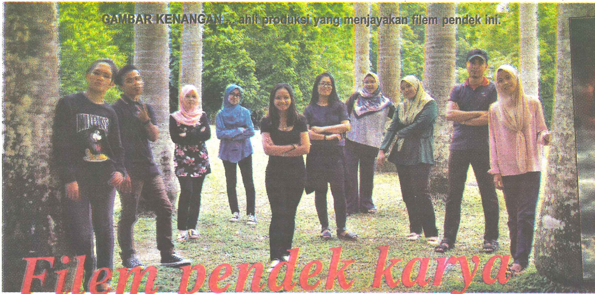
GAMBAR KENANGAN ... ahli produksi yang menjayakan filem pendek ini.