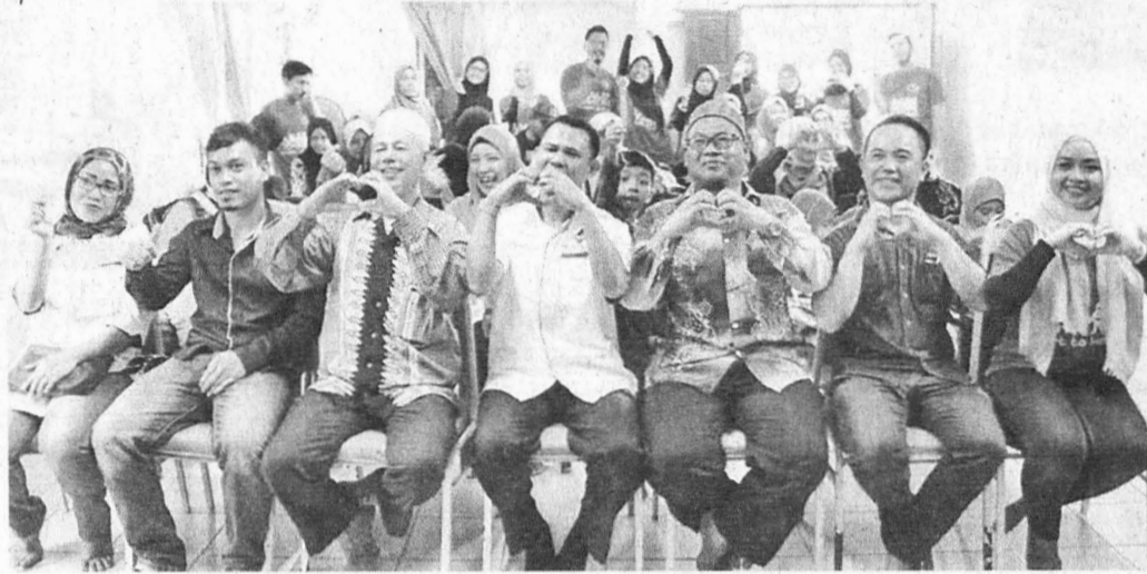
HADIRIN memperlihatkan simbol hati seperti dalam tema program Heart to Heart.

“Program ini amat baik dilaksanakan kerana