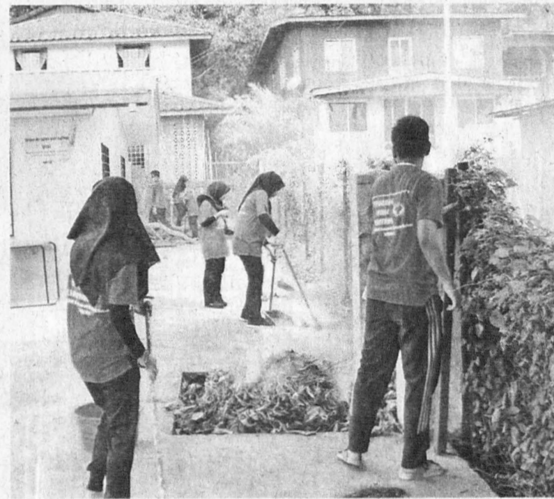
GOTONG royong membersihkan kawasan tadika.

rombongan pelajar turut menyampaikan tiga set meja pelajar, 15 kerusi, dua kabinet dan papan tulis hasil sumbangan beberapa syarikat dan individu.