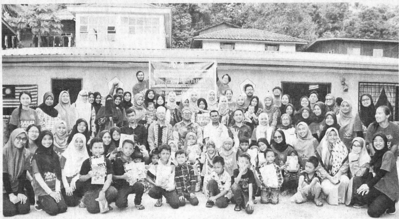
PESERTA dan warga kampung bersama tetamu kehormat pada majlis perasmian Heart to Heart 2018.