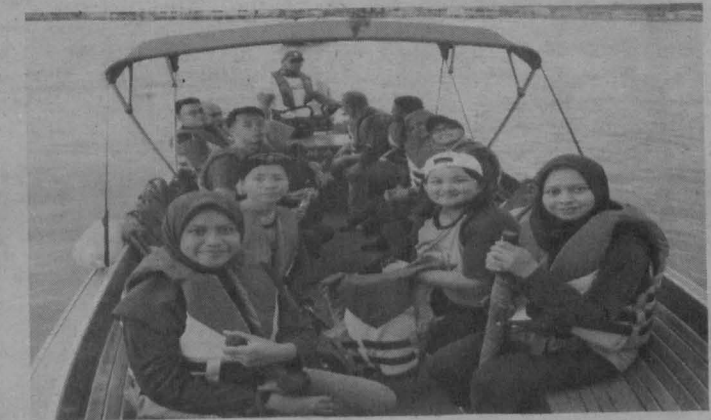
SEBAHAGIAN pelajar PRPA sebelum bertolak ke Kg Tamoi.

Tamoi dan Weston mampu menjadi teladan yang boleh dicontohi," katanya.