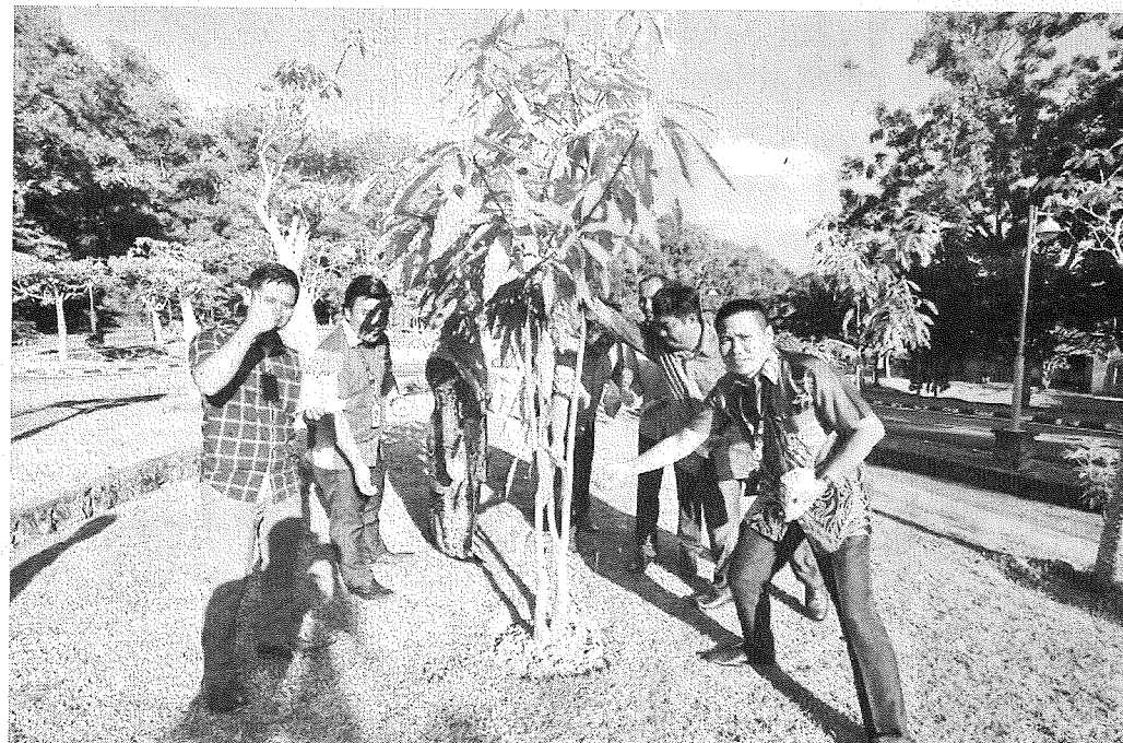
KAKITANGAN HEPA sedang membaja pokok.

sentiasa menjaga tanaman pokok buah-buahan di sekitar kawasan berkenaan.