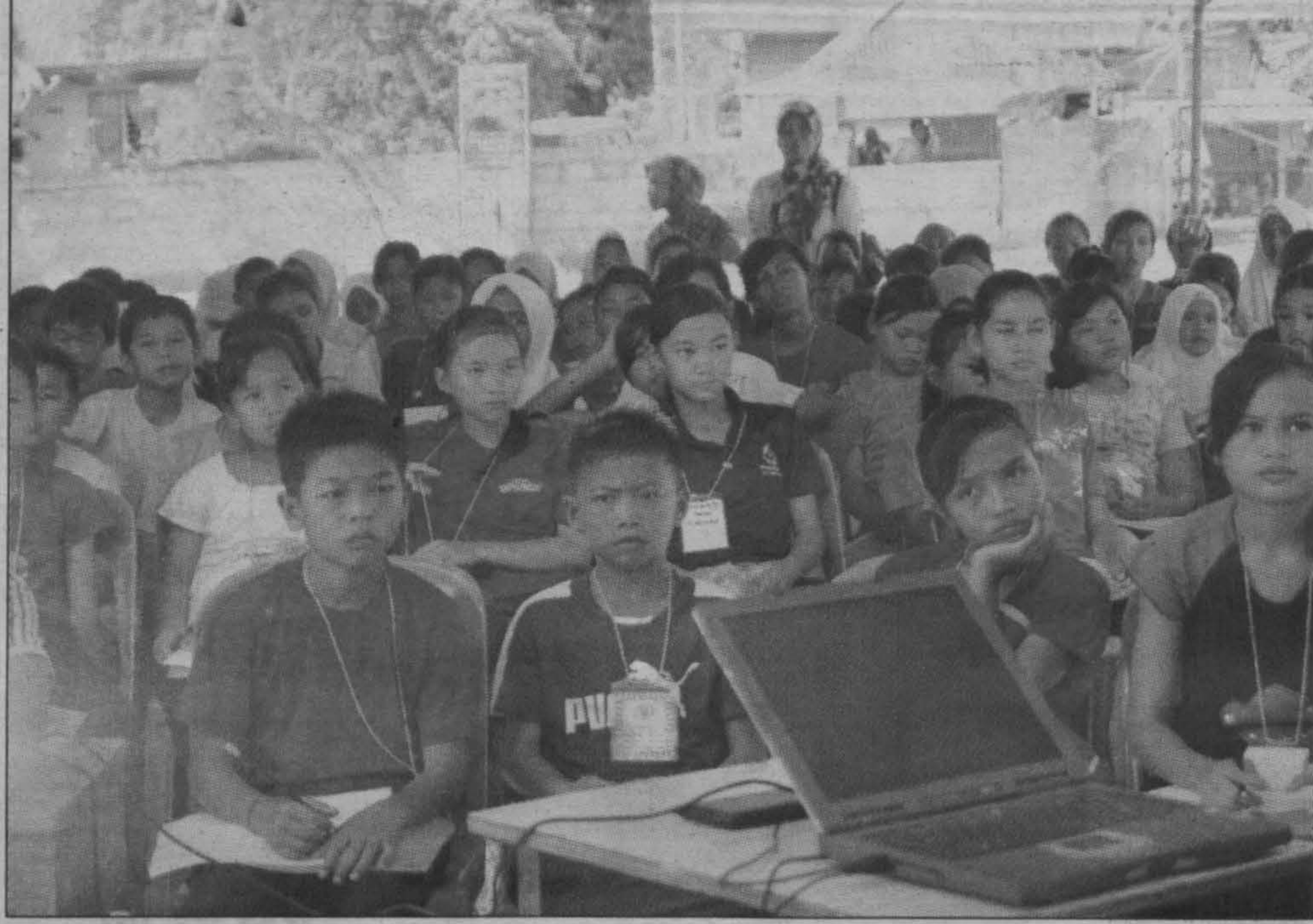
TEKUN... Pelajar sekolah rendah luar bandar menumpukan perhatian terhadap pembelajaran.