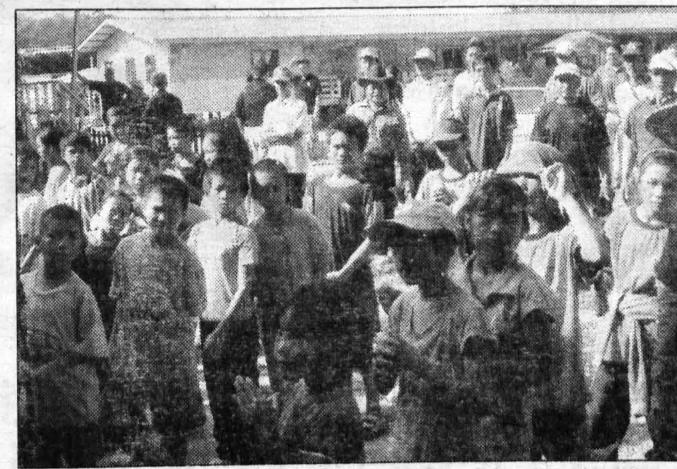
PENDUDUK DAN MURID ... Penduduk kampung bersama murid yang mengikuti program itu.