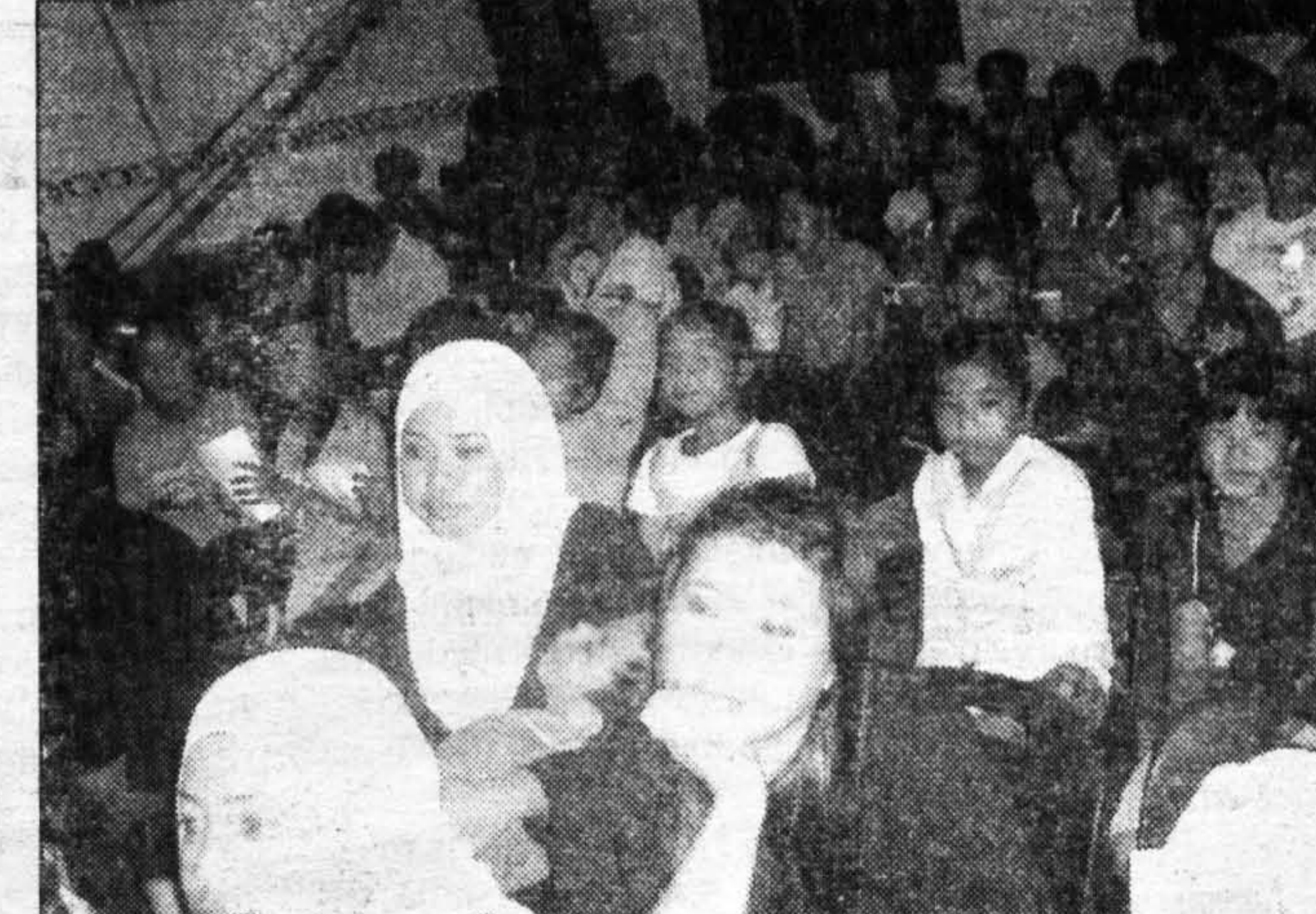
AMBIL BAHAGIAN ... Peserta yang mengikuti program.