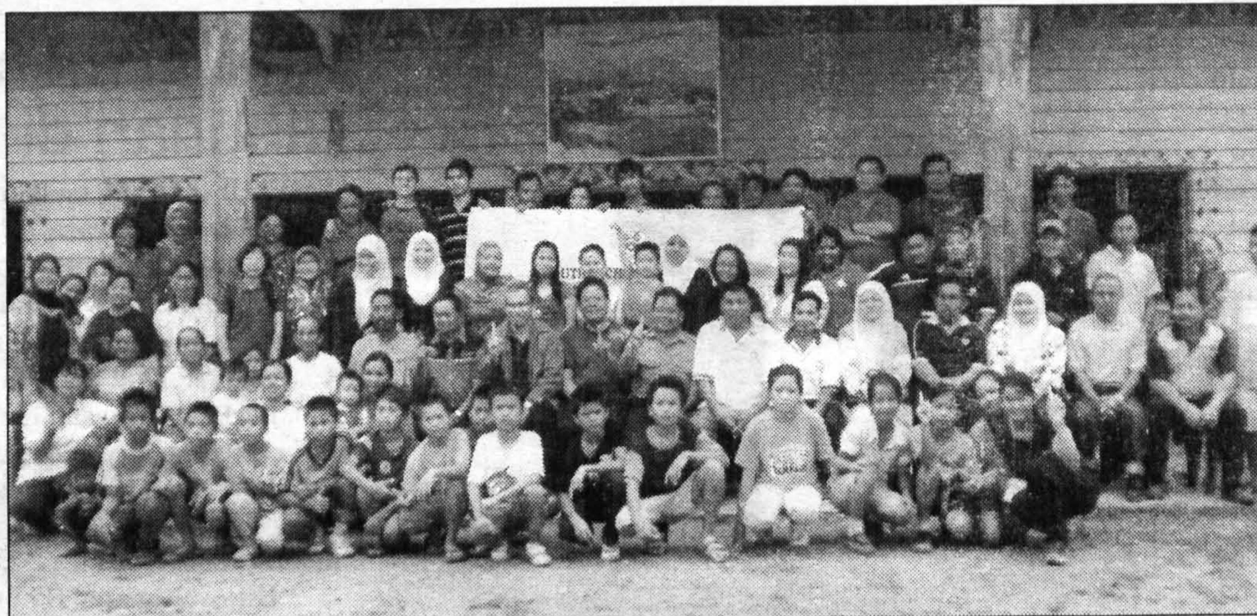
ALBUM KENANGAN ... Penganjur bergambar kenangan bersama penduduk kampung dan murid yang mengikuti program itu.

Sesungguhnya, pengalaman menjalankan program ini adalah pengalaman yang sangat berharga dan dapat menjana pembangunan pendidikan di kawasan yang terpencil.