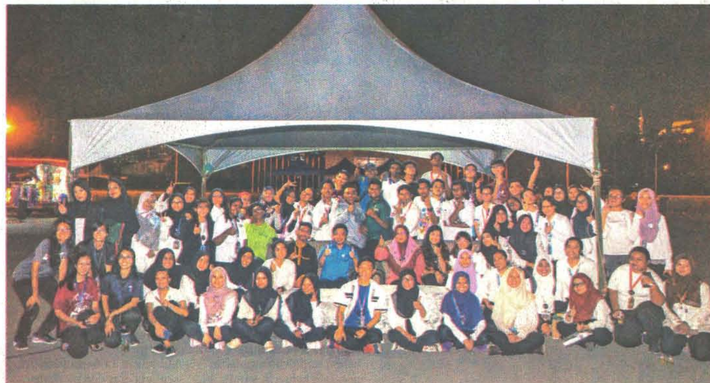
PARA peserta program merakamkan gambar kenangan.