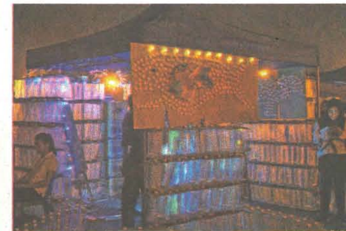
SEBUAH pagar sesat yang diperbuat daripada botol minuman plastik dan kotak kertas terpakai yang dipamerkan.

Turut diadakan acara penyediaan simbol besar ‘60+’ daripada lilin yang diperbuat menggunakan minyak masak terpakai dan diletak dalam bekas yang diperbuat menggunakan botol minuman plastik serta satu pagar sesat (maze) yang disediakan daripada botol minuman plastik dan kotak kertas terpakai juga dipamerkan yang mana, kedua-duanya menarik perhatian ramai orang.