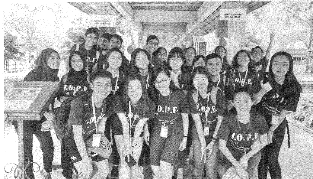
ANTARA peserta yang menyertai projek itu.

"Selain itu, 11 pelajar perubatan dari Zunyi Medical University dari