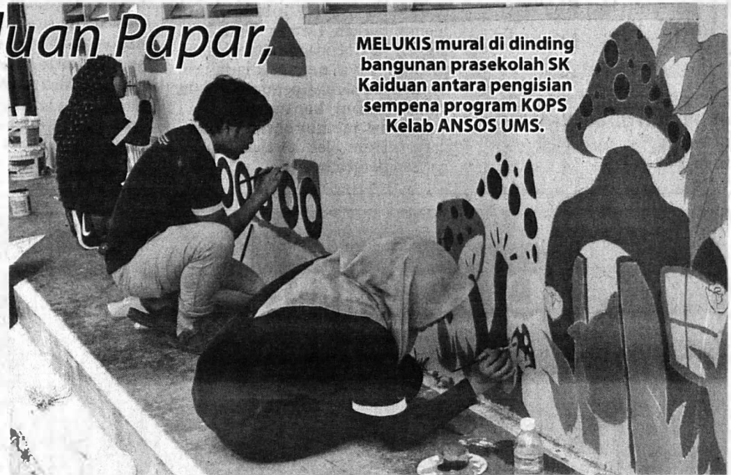
MELUKIS mural di dinding bangunan prasekolah SK Kaiduan antara pengisian sempena program KOPS Kelab ANSOS UMS.

“Kami turut menyediakan barang-barang keperluan asas seperti beras, minyak, gula, garam dan juga mi kuning untuk diagihkan