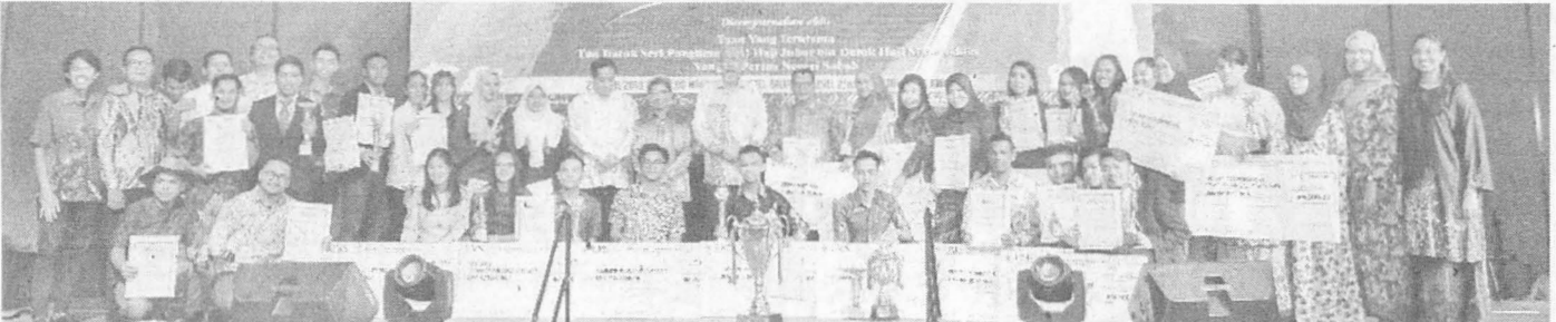
SESI bergambar penerima-penerima anugerah MAHEPA Ke-21 2018 bersama Tun Juhar dan tetamu kehormat.