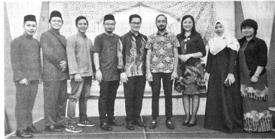
SESI bergambar bersama Ahli Jawatankuasa Pelaksana.