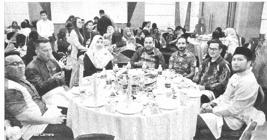
SEKITAR majlis berbuka puasa.

Pengarah Program Hajah Hairuni Kasuagi berkata, majlis ini dianjurkan oleh alumni untuk berbuka puasa bersama dan menyampaikan sumbangan hari raya kepada para pelajar B40 dan M40 Fakulti Psikologi dan Pendidikan.