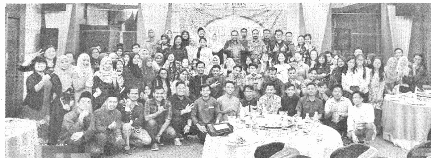
SESI bergambar bersama para peserta. Majlis Iftar Ukhuwah Alumni FPP 2019.

Majlis ini bukan sekadar iftar biasa tetapi dianjurkan untuk berkongsi