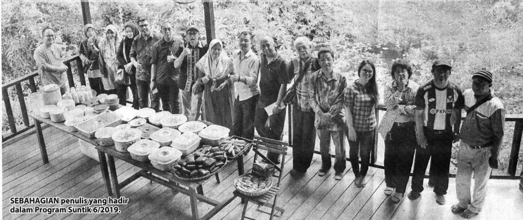
SEBAHAGIAN penulis yang hadir dalam Program Suntik 6/2019.