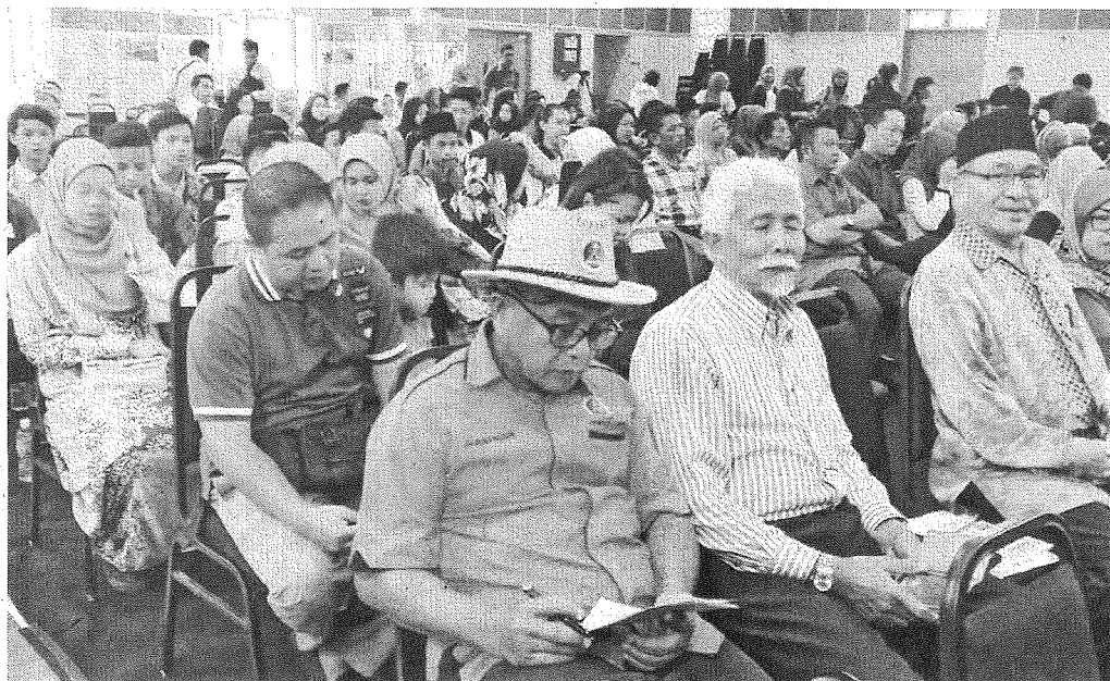
HADIRIN mengikuti program Bicara Muzium Labuan.