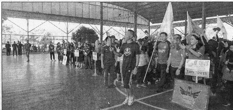
Penyerahan obor kejohanan menandakan SUKUMS Kali KE-18 secara rasminya bermula.