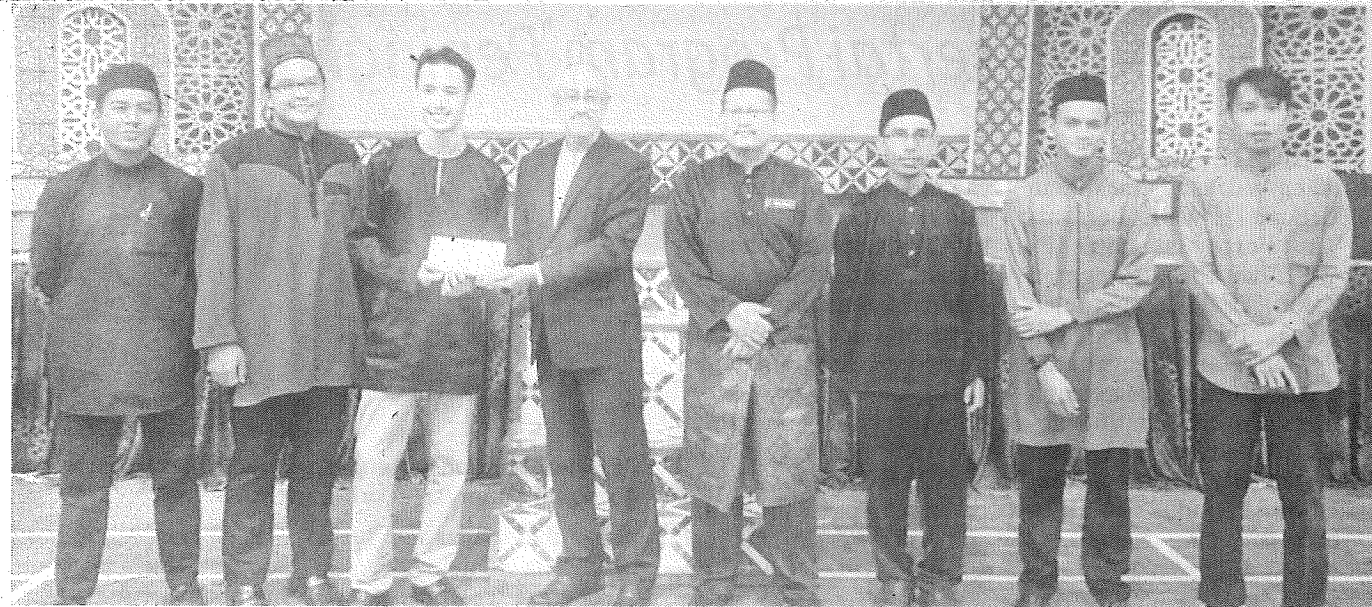
PERASMI bersama pemenang pertandingan menghasilkan Video Dakwah Digital.