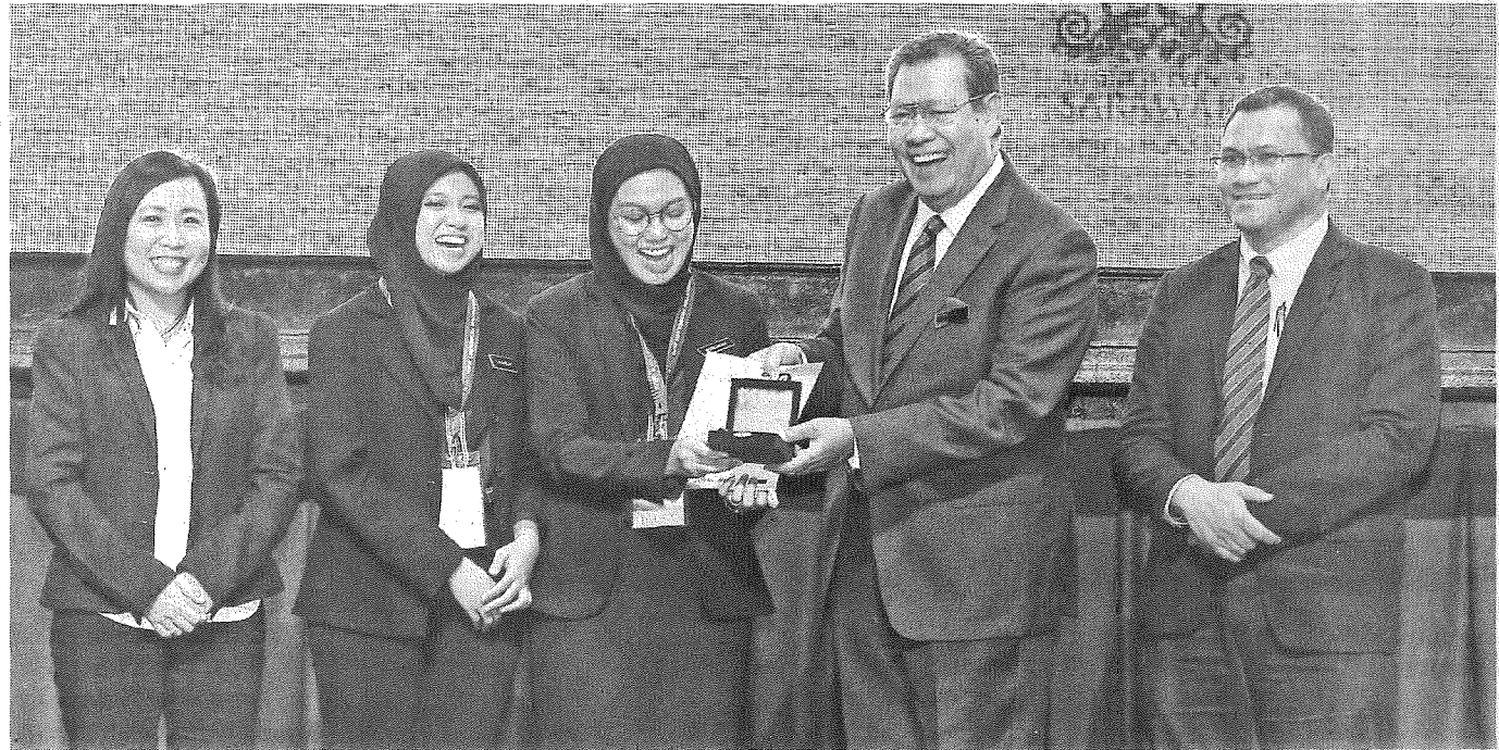
EMAS: Penyampaian pingat emas sewaktu majlis penutupan InTEX19 di Imperial Hotel, Kuching.

Padamasa yang sama, ia juga dapat memupuk semangat dan motivasi pada diri mahasiswa untuk bersaing secara sihat dengan mempamerkan hasil penyelidikan mereka sama ada menerusi produk, idea inovasi ataupun reka bentuk.