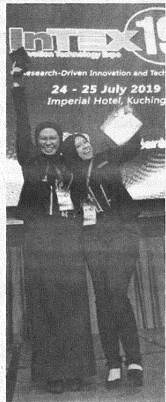
RAI: Kedua-dua mahasiswa UMS meraikan kejayaan mereka.

Kejayaan yang diperolehi adalah hasil sokongan dari segi moral dan kewangan khususnya daripada pihak fakulti, JHEP dan UMS.