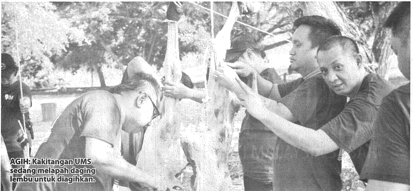
AGIH: Kakitangan UMS sedang melapah daging lembu untuk diagihkan.

“Kita berharap daging ini dapat diagihkan kepada kakitangan UMS yang layak serta golongan yang memerlukan di luar dari universiti ini,” katanya.