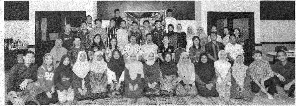
IKTIRAF: MAHEPA platform mengiktiraf jasa dan sumbangan pelajar kepada universiti dan diri sendiri dalam pelbagai aspek termasuklah sukarelawan sukan pencapaian awam keusahawanan.

Sesungguhnya suasana di alam persekolahan dan alam universiti merupakan dua suasana pembelajaran dan perhubungan sosial yang berbeza. Pelajar perlu berusaha menyesuaikan diri dan beradaptasi dengan alam kampus yang memerlukan pergaulan lebih luas dalam berhubung bukan sahaja dengan rakan-rakan lain malah termasuklah pensyarah dan pegawai universiti dalam apa jua urusan dan kerja yang berkaitan. Sebagai contoh segala keperluan berkaitan kebajikan dan aktiviti pelajar pegawai dari JHEP, aspek