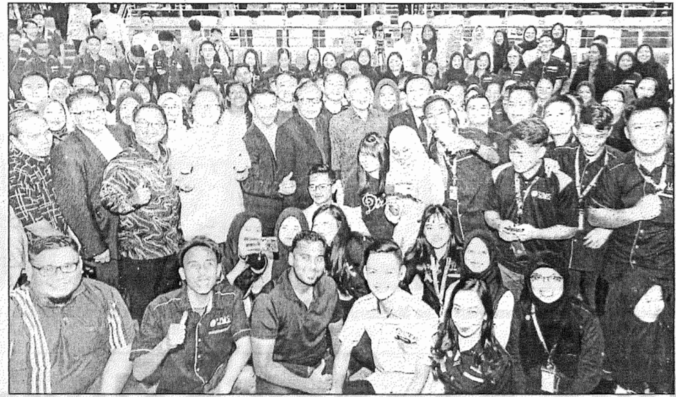
KENANGAN ... Anwar (tengah) bergambar kenangan bersama siswa siswi UMS selepas sesi dialog pada Selasa malam.

"Saya percaya UMS adalah sebuah gedung ilmu yang bukan sahaja memberi impak besar kepada negeri Sabah, bahkan juga pada negara Malaysia.