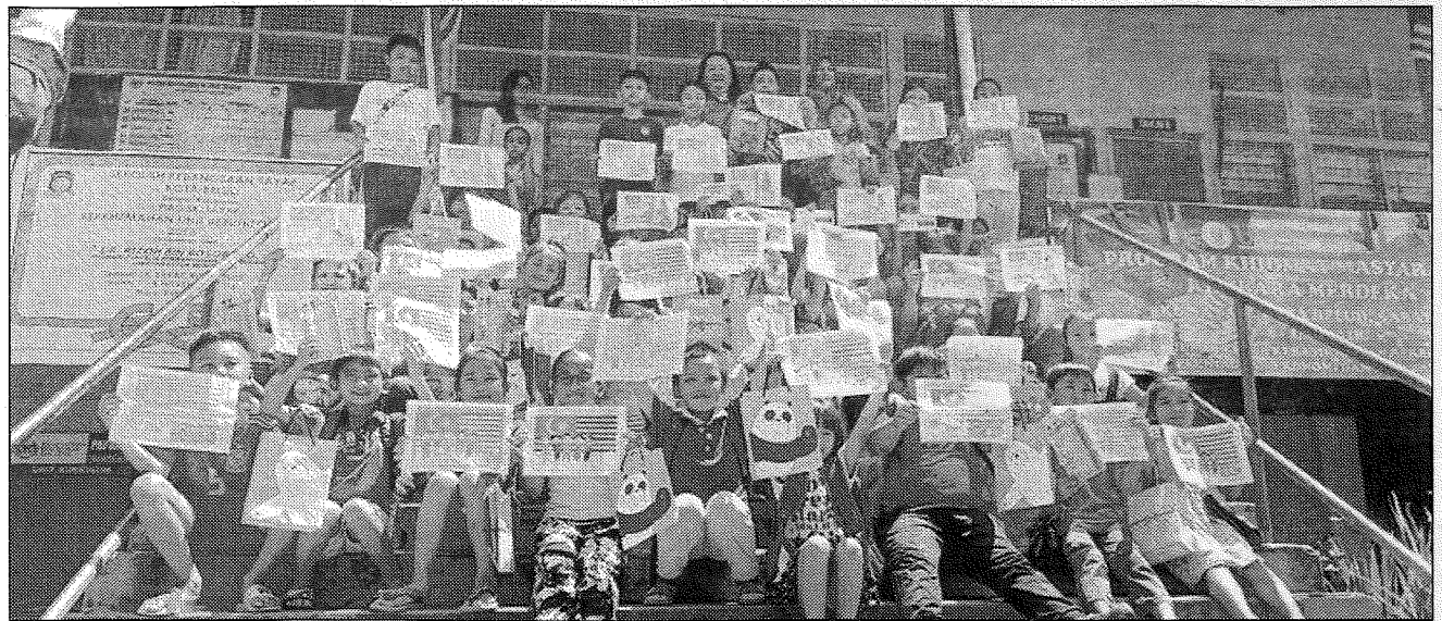
CERIA ... Wajah gembira para pelajar SK Sayap ketika menunjukkan hasil mereka dalam pertandingan mewarna Jalur Gemilang.

"Bagi membaiki jambatan gantung pula, selain dari mem-