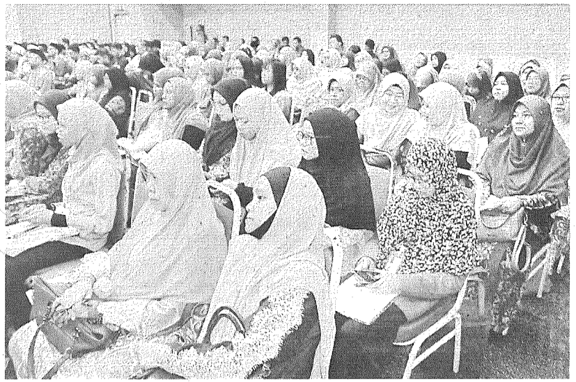
KHUSYUK: Peserta wanita khusyuk mendengar pembentangan kertas kerja oleh ahli panel.

Justeru, beliau menyeru peserta untuk menggunakan khidmat