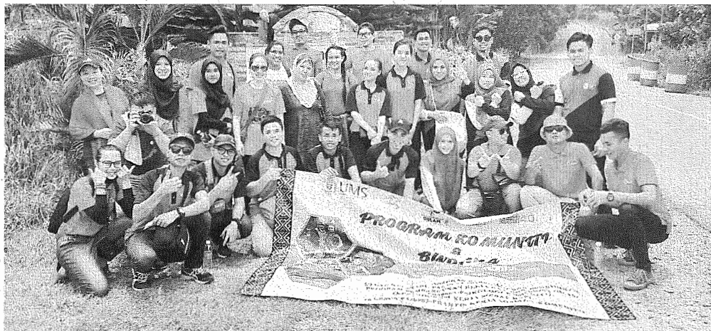
PESERTA: Rombongan peserta program Komuniti dan Budaya yang terdiri daripada pelajar dan kakitangan FPP.