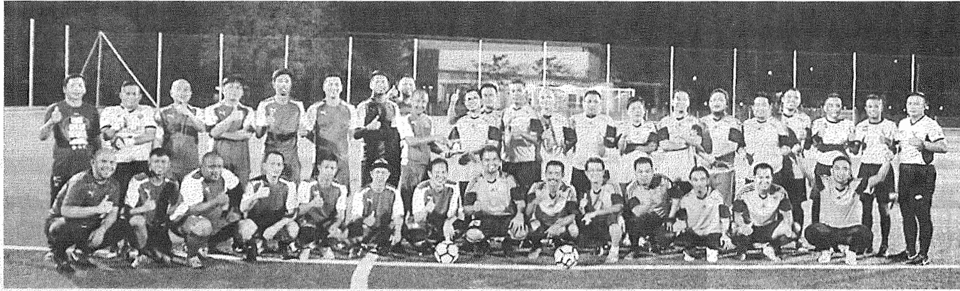
ALBUM KENANGAN: Pemain UMSKAL (kanan) dan KKMM Labuan bergambar kenangan sebelum perlawanan persahabatan bermula di Padang Sintetik, Kompleks Sukan Labuan.