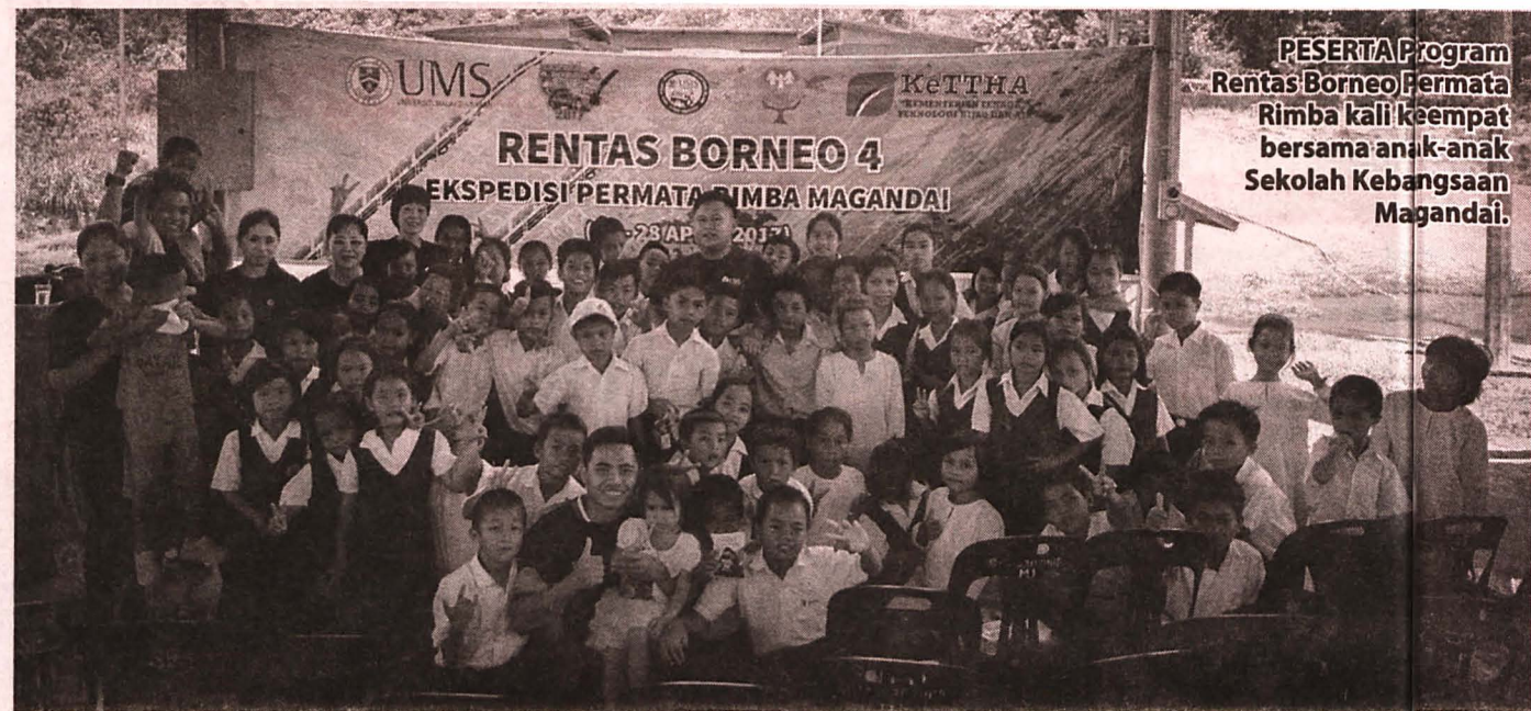
PESERTA Program Rentas Borneo Permata Rimba kali keempat bersama anak-anak Sekolah Kebangsaan Magandai.

Ramai ahli rombongan yang mengambil gambar kerana pemandangan sungai yang mengalir deras menggamit