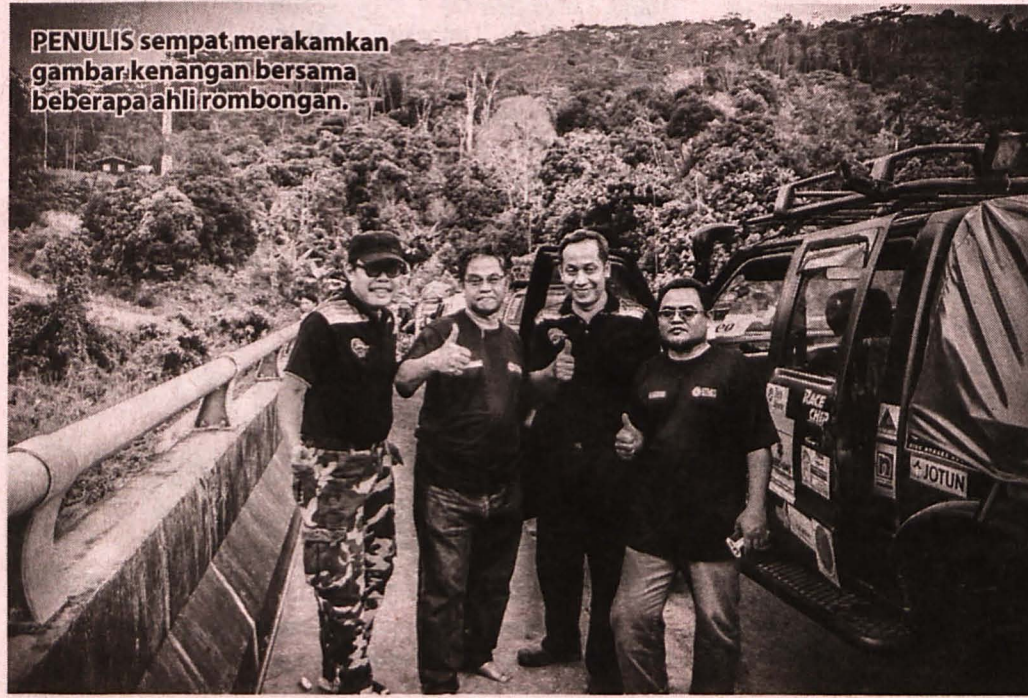
PENULIS sempat merakamkan gambar kenangan bersama beberapa ahli rombongan.

Pada hari keempat sampailah saat kami berpisah setelah beramah mesra dengan alam dan juga penduduk Magandai. Rasa sayu menyelubungi hati ahli rombongan yang lain kerana lambaian tangan anak-anak sekolah di sepanjang jalan keluar ke kampung menggamit kami datang semula dan juga menyampaikan pesan kesusahan mereka kepada masyarakat luar dan pihak berkuasa agar mengambil pemeduliaan terhadap nasib mereka yang 'terlupakan'.