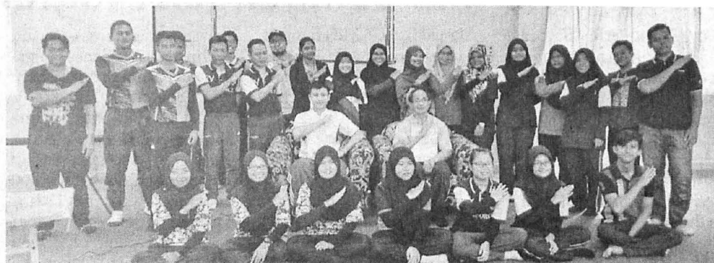
PARA penceramah dan para peserta bergambar kenangan selepas program itu.

Hadiah kepada para pemenang telah disampaikan oleh Timbalan Pengetua Kolej Kediaman Herman Salah.