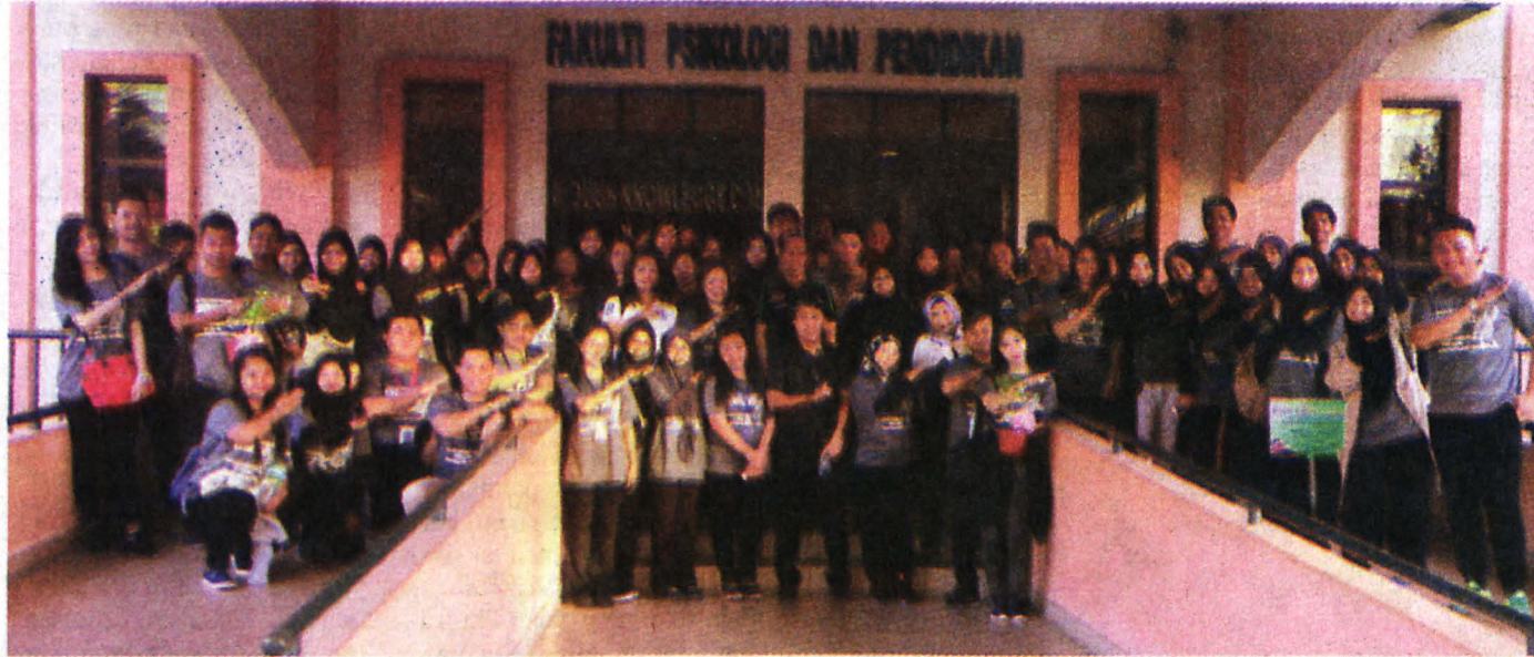
MAJLIS Pelancaran Program di Fakulti Psikologi dan Pendidikan serta gambar rombongan pelajar dan pegawai pengiring sebelum bertolak ke sekolah masing-masing.