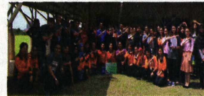
GAMBAR AJK program bersama pelajar di Kolej Tingkatan Enam Kota Kinabalu.

pelajar sekolah bagi membantu meningkatkan kecemerlangan dan pencapaian akademik