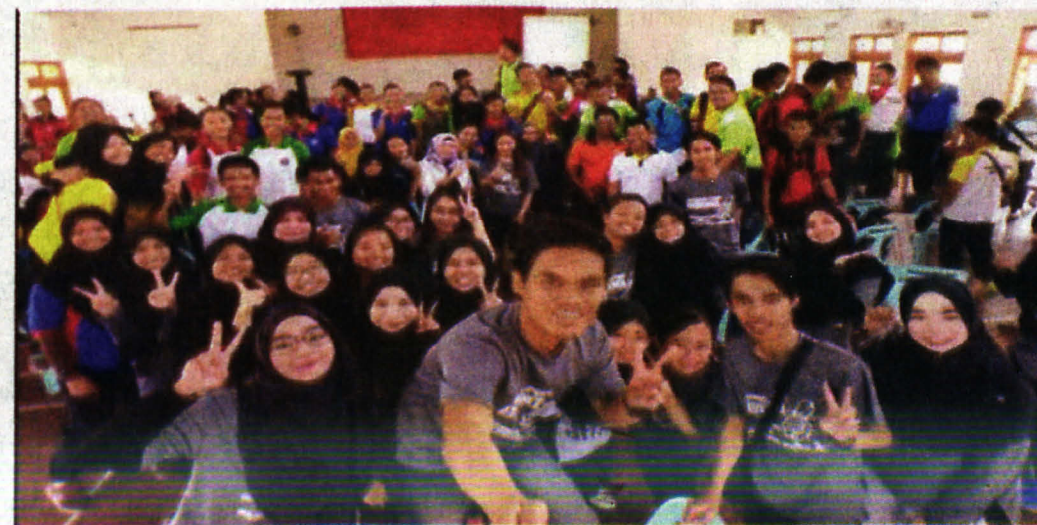
GAMBAR AJK program bersama pelajar di SMK Apin-Apin, Keningau.