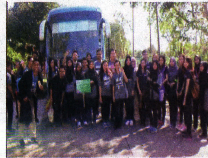
GAMBAR AJK program di SMK Bongawan, Papar.