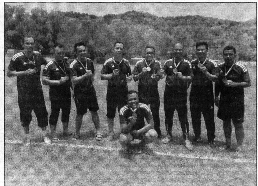
PASUKAN The Legend mendapat tempat ketiga Bola Sepak 7 Sebelah (Veteran).