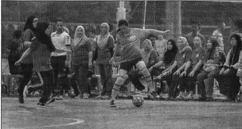
TUNJUK SKIL .... Sukan futsal antara yang dipertandingkan.

Pada kejohanan tersebut, kontinjen Super 7 cemerlang apabila menduduki tangga teratas dalam pungutan pingat keseluruhan, dengan kutipan empat emas, lima perak dan satu