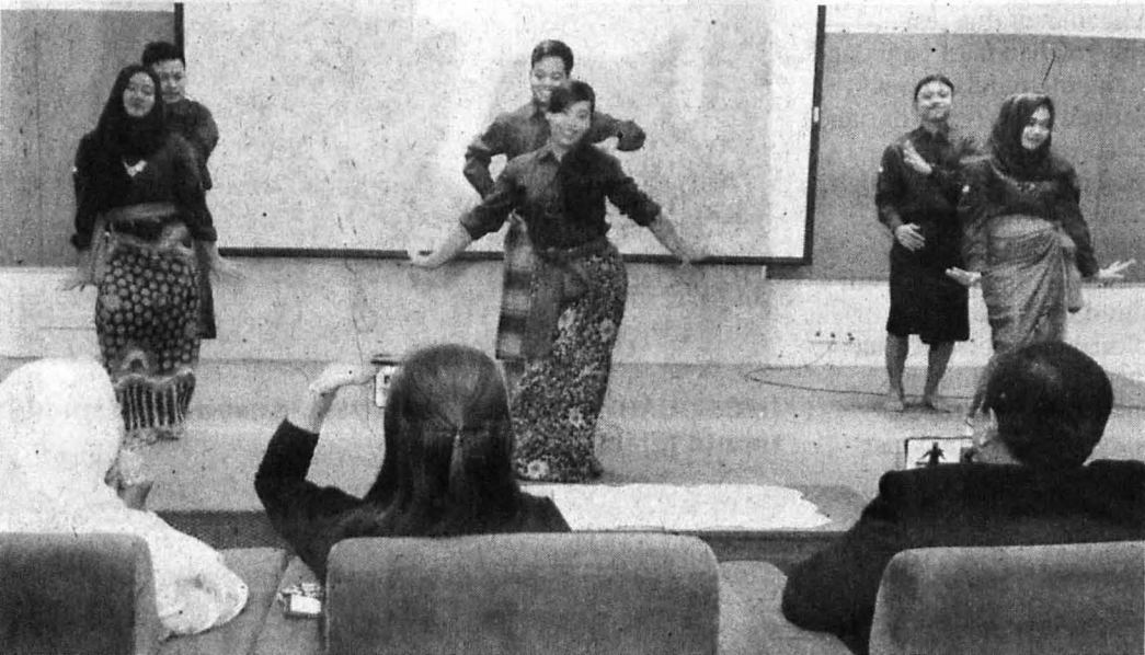
PERSEMBAHAN tarian daripada pelajar UNPAS.