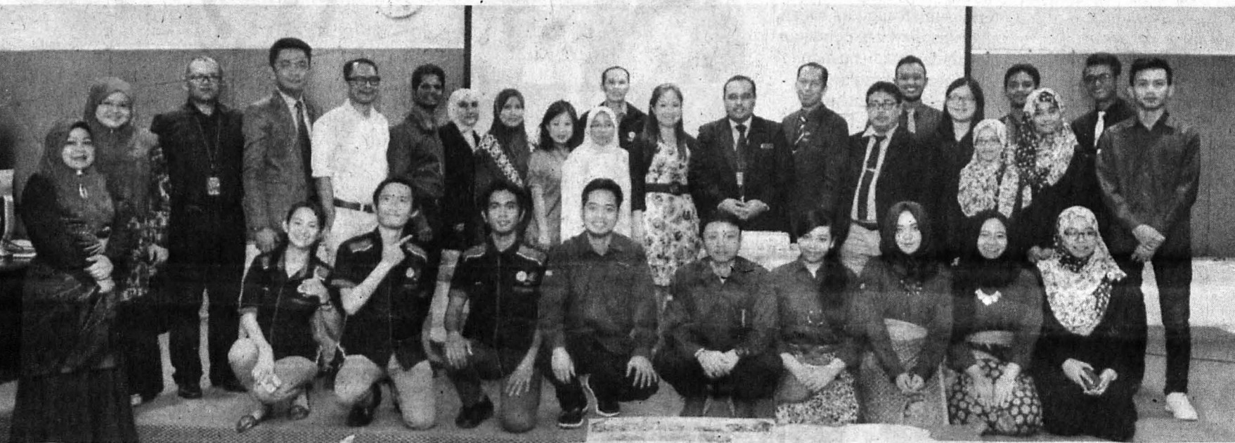
PELAJAR mobiliti bergambar kenangan dengan dekan dan para pensyarah FPP UMS.

peluang untuk mereka mempelajari budaya yang terdapat di ketiga-tiga universiti berkenaan.