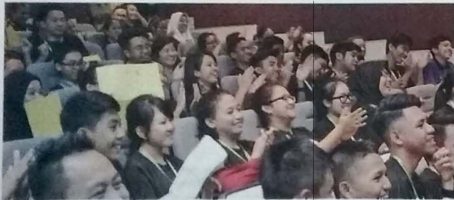
SEBAHAGIAN peserta semasa bengkel berlangsung.

Dengan penganjuran bengkel ini, persepsi terhadap medium filem penting untuk dijadikan bahan dakwah, menyampaikan idea, percambahan fikiran, mengkhabarkan peristiwa semasa dan sensasi, mengiklankan barang dan perniagaan serta penghasilan dokumentari, filem-filem pendek dan cereka khususnya.