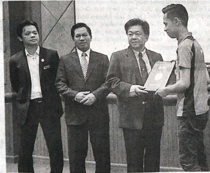
YEO menyampaikan penghargaan kepada peserta.

Bagaimanapun, kerajaan menggalakkan pelajar