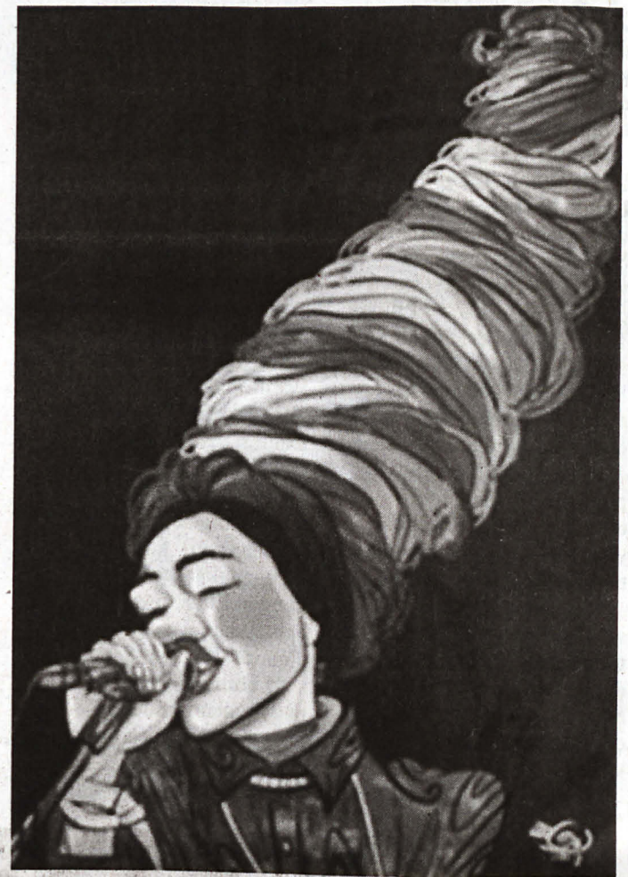
KARIKATUR Yuna oleh Oly.