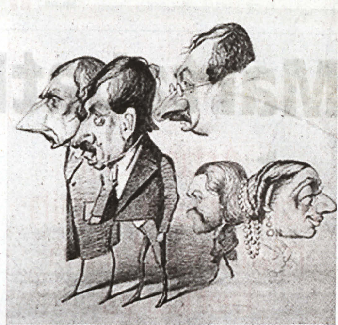
KARIKATUR Claude Monet.