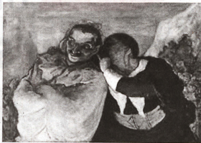
KARIKATUR Honore Daumier.

“ Seni karikatur merupakan satu aliran seni visual yang santai tetapi membawa impak yang baik dalam menyampaikan pernyataan pelukis kepada khalayak. Lukisan tersebut boleh dianggap sebagai terapi kepada insan yang menghadapi masalah mental dan mendapat tekanan. Justeru, karikatur bukan sahaja dihasilkan dalam bentuk lukisan di atas kertas atau kanvas bahkan telah menjadi filem dan karakter dalam teater dengan watak yang melucukan. ”