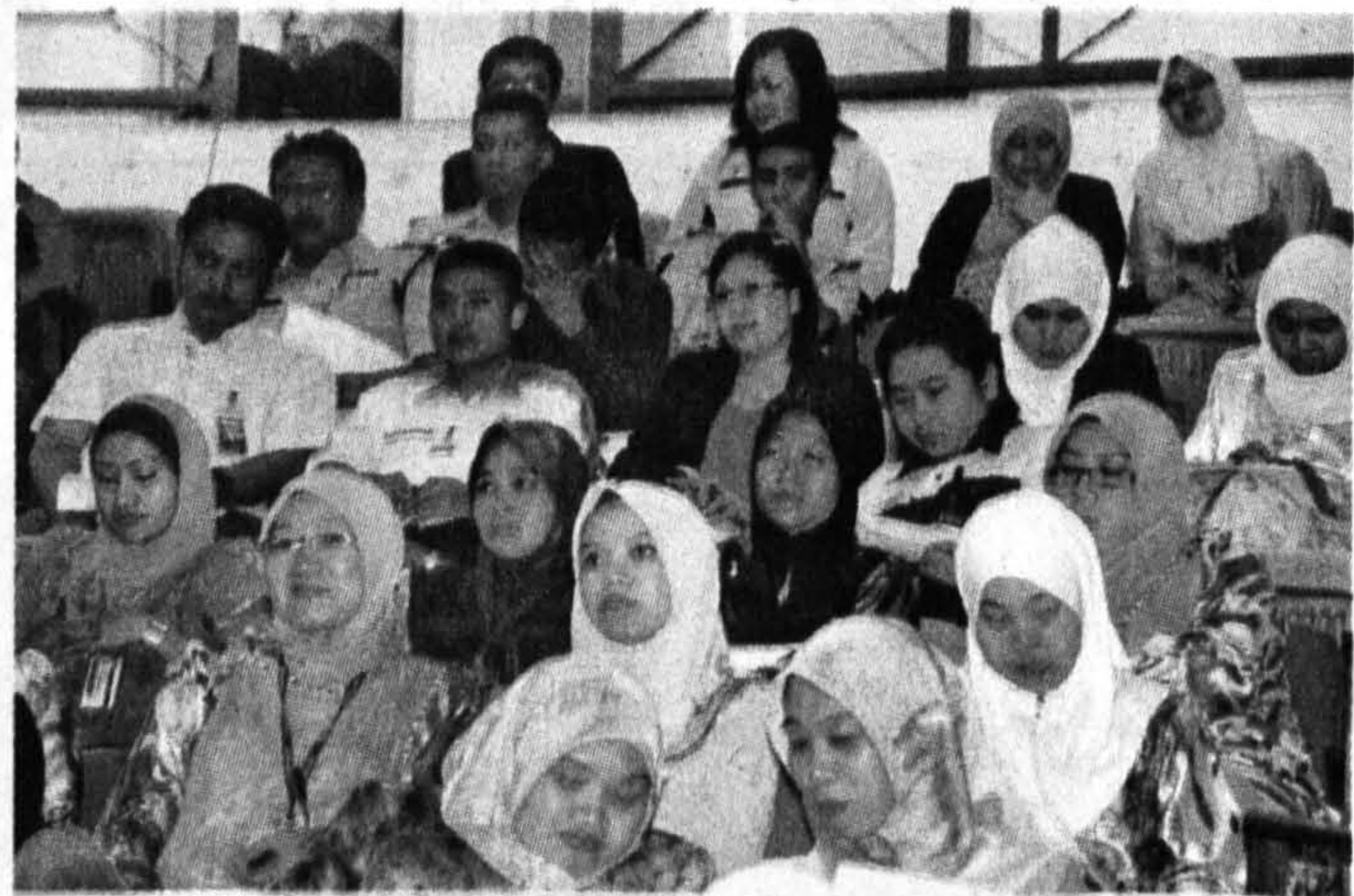
TAKLIMAT...Sebahagian kakitangan UMS-KAL yang menghadiri Taklimat Ketidakhadiran Tanpa Cuti kelmarin.

Katanya, bagi pegawai yang tidak hadir bertugas