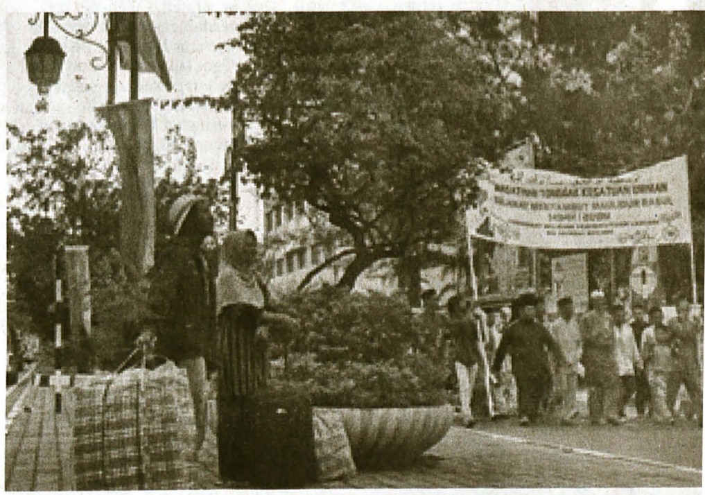
(Gambar bawah) MAULUD, Ramlen Salleh, 2013.