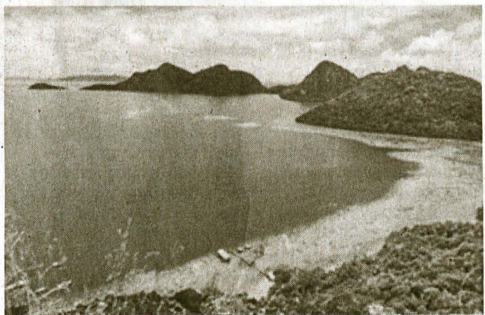
(Gambar atas) BOHAY Dulang, Foto karya Daimsara Abdullah, 2016.

“Melalui seni fotografi beliau lebih cenderung untuk meneroka terutamanya negara luar, umpamanya beliau telah melawat Australia, New Zealand, Filipina, Indonesia dan beberapa buah negara Asean bertujuan bertukar pandangan dengan artist tempatan.