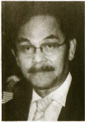
CATATAN KANVAS KOYAK