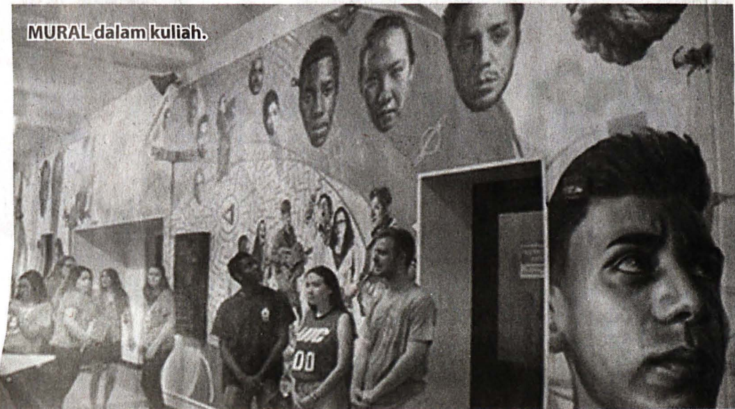
MURAL dalam kuliah.

***PENULIS merupakan Pensyarah Seni Visual, Fakulti Kemanusiaan, Seni dan Warisan di Universiti Malaysia Sabah (UMS).***