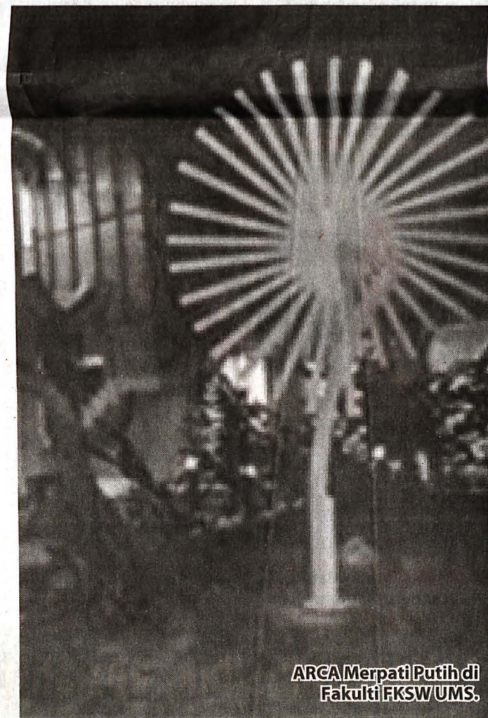
ARCA Merpati Putih di Fakulti FKSU/UMS.

moral warga institusi pengajian awam dan juga manusia sejagat.