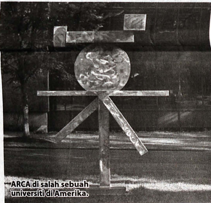
ARCA di salah sebuah universiti di Amerika.